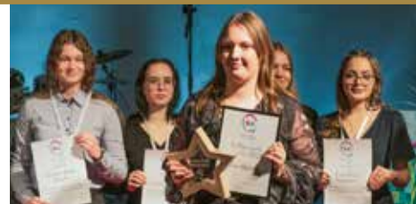
Sumina gada jauniešus