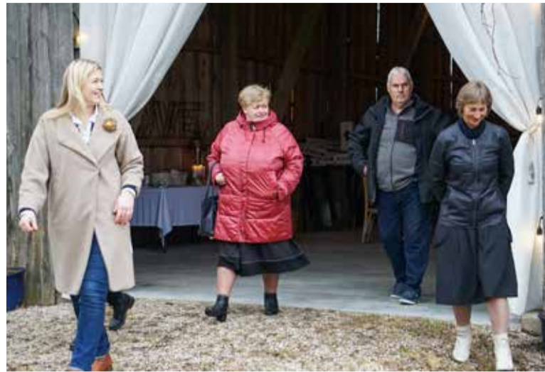
Skrundas puses uzņēmēji apvienojušies, lai dibinātu biedrību. Šajā reizē tikšanās notika Raņķu pagastā esošajā svinību vietā "Gulbji".