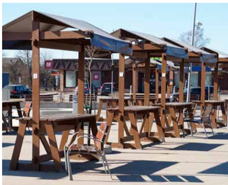
Tiek aktualizēta Skrundas tirgus attīstības iecere un tā potenciālā izmantošana.

Uzņēmēju tikšanās pasākumā Skrundas kultūras namā bija izkristalizējies jautājums par tirgus teritorijas sakārtošanu un atdzīvināšanu. "Uzņēmēji izteica vēlmi pēc vietas, kur iespējams nodot savas preces tirdzniecībai. Nepieciešams vairāk domāt par mājražotāju darbības atbalstu. Tā kā tirgus vēsturiski ir vieta, kur cilvēkiem satikties, izklaidēties un atpūsties, tad visas šīs jomas ir jāaktualizē. Viens no pirmajiem darbiem ir Skrundas tirgus zīmes izvietošana, lai piesaistītu garāmbraucēju uzmanību un liktu viņiem šeit apstāties. Domājam par izvietoto konteineru papildus aprīkošanu, piedāvājot vietējiem mājražotājiem