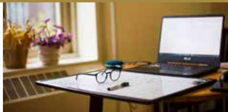
Izstrādāts padziļināto kursu piedāvājums vidusskolēniem