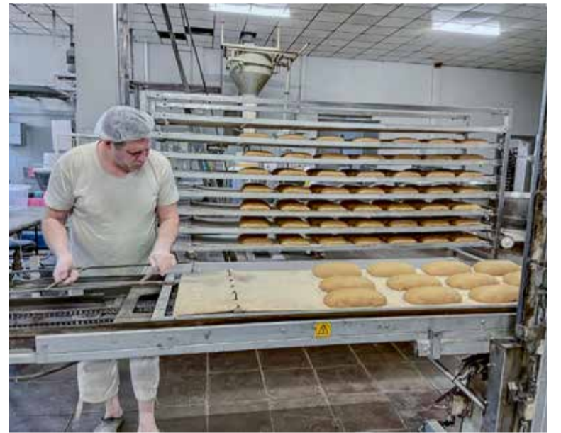
Kuldīgas maizes ceptuvē ik dienu top gardākā maize Latvijā.