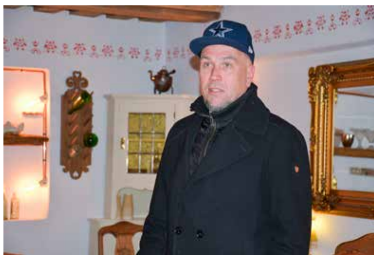
Artis Rozītis novada domes pārstāvjiem izrādīja viesnīcas "Sīmanis" viesmīlīgās telpas, kas atrodas Kuldīgas pilsētas centrā.

Stender's picērijas darbojas Kurzemes reģionā jau vairāk nekā 20 gadus – Kuldīgā, Saldū, Talsos un Ventspilī, kur savu tirgu ir iekarojušas uz palikšanu. Kā jau klusajā sezonā, vairāk cilvēku aktivitāte jūtama brīvdienās, taču, sākoties