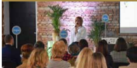
Tiekas tūrisma uzņēmēji