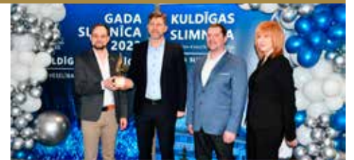
Kuldīgas slimnīca iegūst gada balvu medicīnā