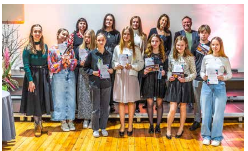
Skatuves runas konkursa dalībnieku sveikšana 7.-9. klašu un 10.-12. klašu grupās.