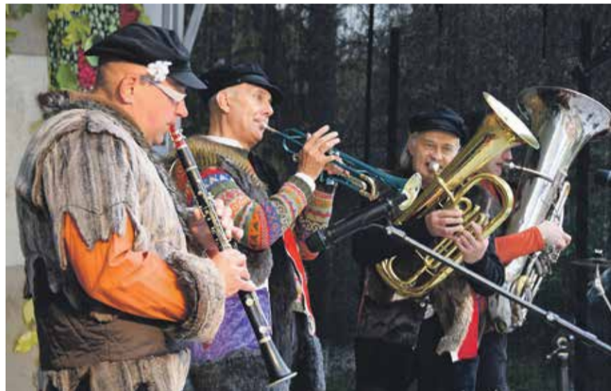
Atklājot pasākumu, uz skatuves kāpa kapela „Saimniekdēli”, kas kājas iekustināt lika ne vienam vien apmeklētājam.

11. oktobrī Kuldīgas Pilsētas dārzā tradicionālais kuģa dižgabala spēriens deva startu Hercoga Jēkaba gadatirgum – vienam no Kurzemes savdabīgākajiem pasākumiem.