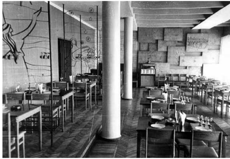
Kuldīgas rajona patērētāju biedrības restorāns „Venta” 1971. gadā.

Pagājušajā sezonā kavējāmies atmiņās par Veckuldīgas pilskalnu,