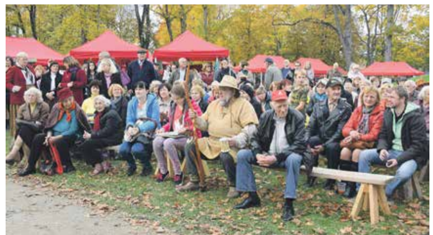
Tuvi un tāli viesi priecējās ne tikai par iespēju pamieļot acis un vēderus, bet arī par atraktīvo muzikantu uzstāšanos.