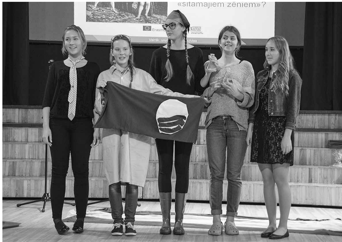
Karjeras nedēļu atklāja konkurss „Kādās korpēs iekāpis, tādās jāstaiģā”, 1. vietu tajā ieguva Kuldīgas 2. vidusskolas komanda.

Karjeras nedēļas pasākumi veiksmīgi varēja notikt, pateicoties Kuldīgas Bērnu un jauniešu centram, Kuldīgas novada sporta skolai,