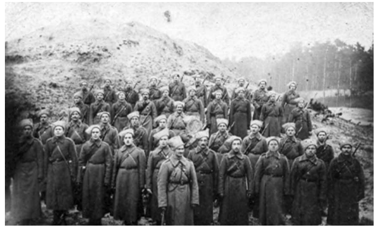
Pirmā pasaules kara kareivji 1914. gadā.

KRISTA JANSONE, Kuldīgas novada muzeja Mārketinga un izglītības nodaļas vadītāja