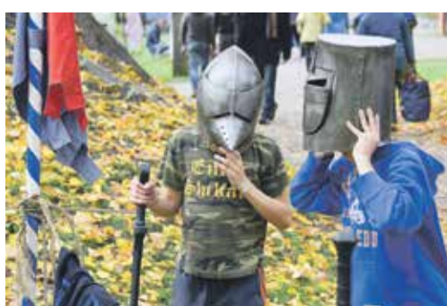
Seno spēļu gravā Niedru liju cilts ļāva iejusties bruņinieku lomā gan maziem, gan lieliem, pieļaujot bruņucepures un iemēģinot roku zobenu cīņās.