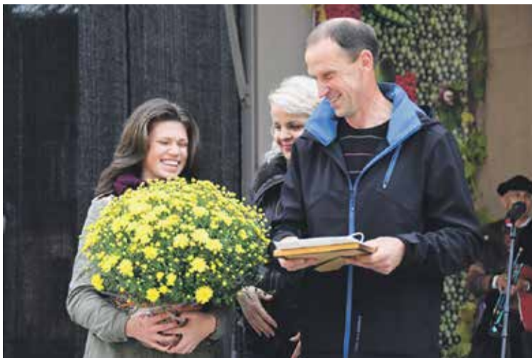
Gudenieku pagasta „Smīdru” saimnieki priecājas par iegūto 1. vietu konkursa „Sakoptākā Kuldīgas novada lauku sēta 2014” grupā „Zemnieku saimniecība”.

Konkursa „Skaistākais Kuldīgas dārzs un sakoptākā teritorija 2014” grupā „Ģimeņu māju teritorija” 1. vietu ieguva Ionašku ģimene Pīlādžu ielā 10; 2. vietu – Dace Cine Strautu ielā 5; 3. vietu – Vaivadu ģimene Vidus ielā 35. Atzinību sa-