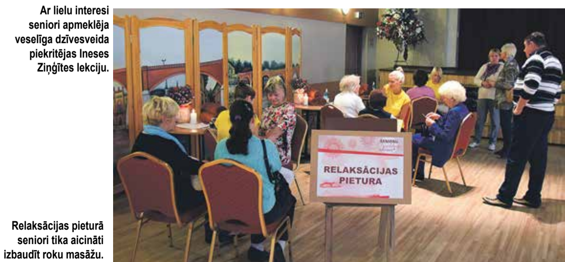
Relaksācijas pieturā seniori tika aicināti izbaudīt roku masāžu.