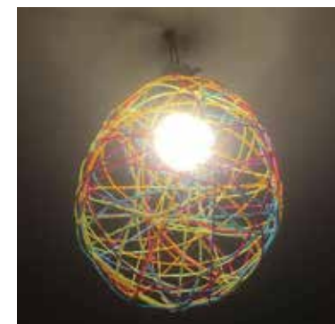
UNDĪNE BALODE (2. kurss).