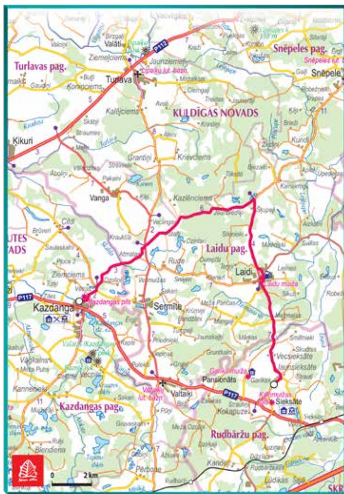
SS2 / SS5 - Laidi 21,95 km 13.10.18 Ātrumposmu slēdz no 09:10 līdz 18:00

SS2 / SS5 – Laidi 21,95 km 13. oktobrī ātrumposmu slēgs no 9.10 līdz 18.00.