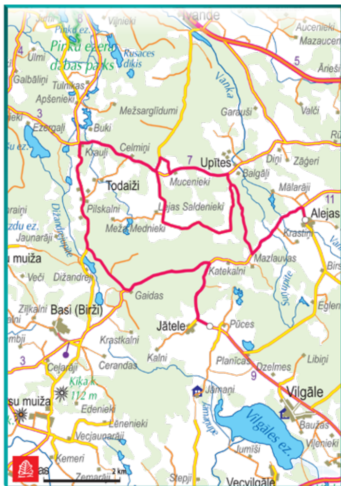
SS3 - Upītes 21,89 km / SS6 - Vilgāle 24,14 km 13.10.18 Ātrumposmu slēdz no 10:25 līdz 19:15

SS3 – Upītes 21,89 km / SS6 – Vilgāle 24,14 km 13. oktobrī ātrumposmu slēgs no 10.25 līdz 19.15.