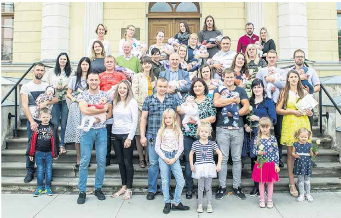
Pēc sudraba karotiņu svinīgas saņemšanas mazuli kopīgi fotografējās pie Kuldīgas novada Domes.

SIGNETA LAPIŅA, sabiedrisko attiecību speciāliste