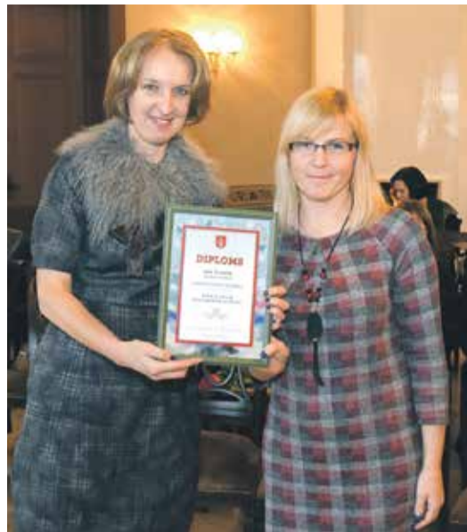
„Modes nams Kolāža” par rūpīgi izdekorētajiem skatlogiem tika atzīts par labāko konkursa nominācijā „Skatlogi”.

Par uzvarētāju kategorijā „Skatlogi” komisija atzina veikalu „Modes nams Kolāža” Kuldīgā, Liepājas ielā 11, bet atzinības rakstus šajā kategorijā saņēma dāvanu un suvenīru veikals „Burvju ota”, Liepājas ielā 1, veikals „Pie Undīnes” Liepājas ielā 4, veikals „Mežrozīte”, Liepājas ielā 32, veikals „Pindzele” un „PC Konsultants”, Raiņa ielā 2 un 4. Kategorijā „Ēku fasādes un priekšpagalmi” par krāšņāk izdekorēto atzina SIA „Amazone” ēku Deksnas