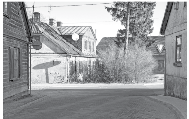
Virzienā no Grants ielas uz Ventspils ielu turpmāk būs jānod ceļš.

Savukārt, lai uzlabotu drošību Dārza ielā, posmā no Vītola līdz Grants ielai, kur no rītiem notiek intensīva autotransporta un gājēju kustība, vedot bērnus uz skolu, tiks uzlikta zīme „Dzīvojamā zona”, kā arī ceļa ātrumvalnis.