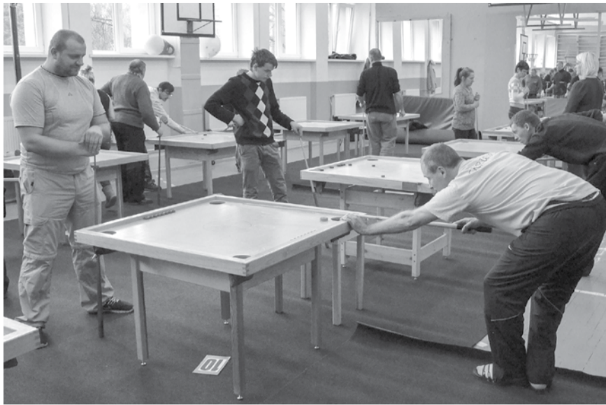
Ziemas sporta spēļu dalībnieki kuplā skaitā piedalījās novusa sacensībās.

SIGNETA LAPIŅA, sabiedrisko attiecību speciāliste