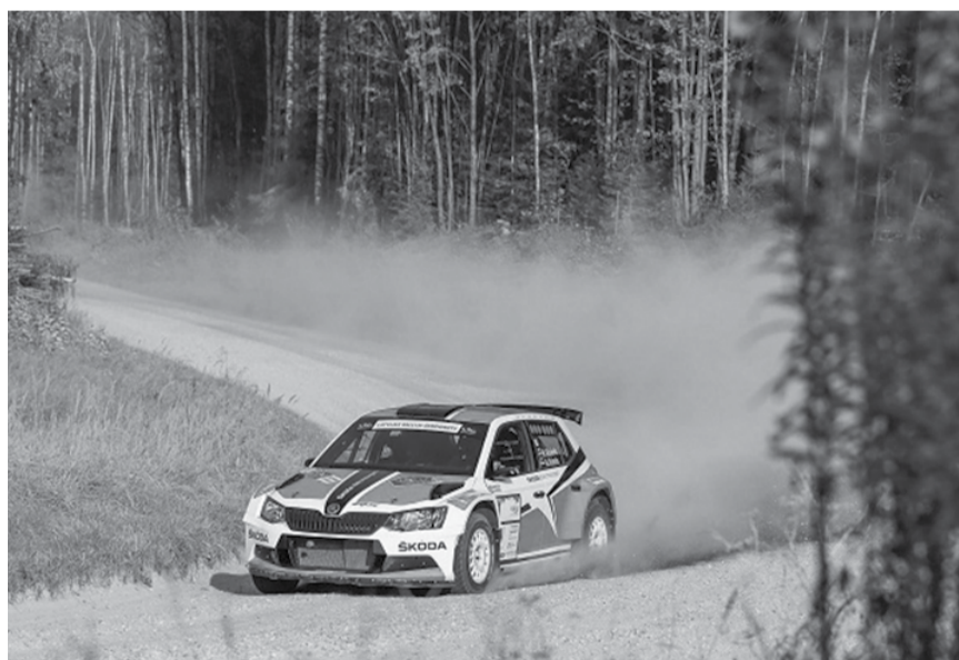
Eiropas rallija čempionāta „Rally Liepāja” posms pārcelts uz septembra vidu.

JĀNIS UNBEDAHTS, „RA Events” sabiedrisko attiecību speciālists