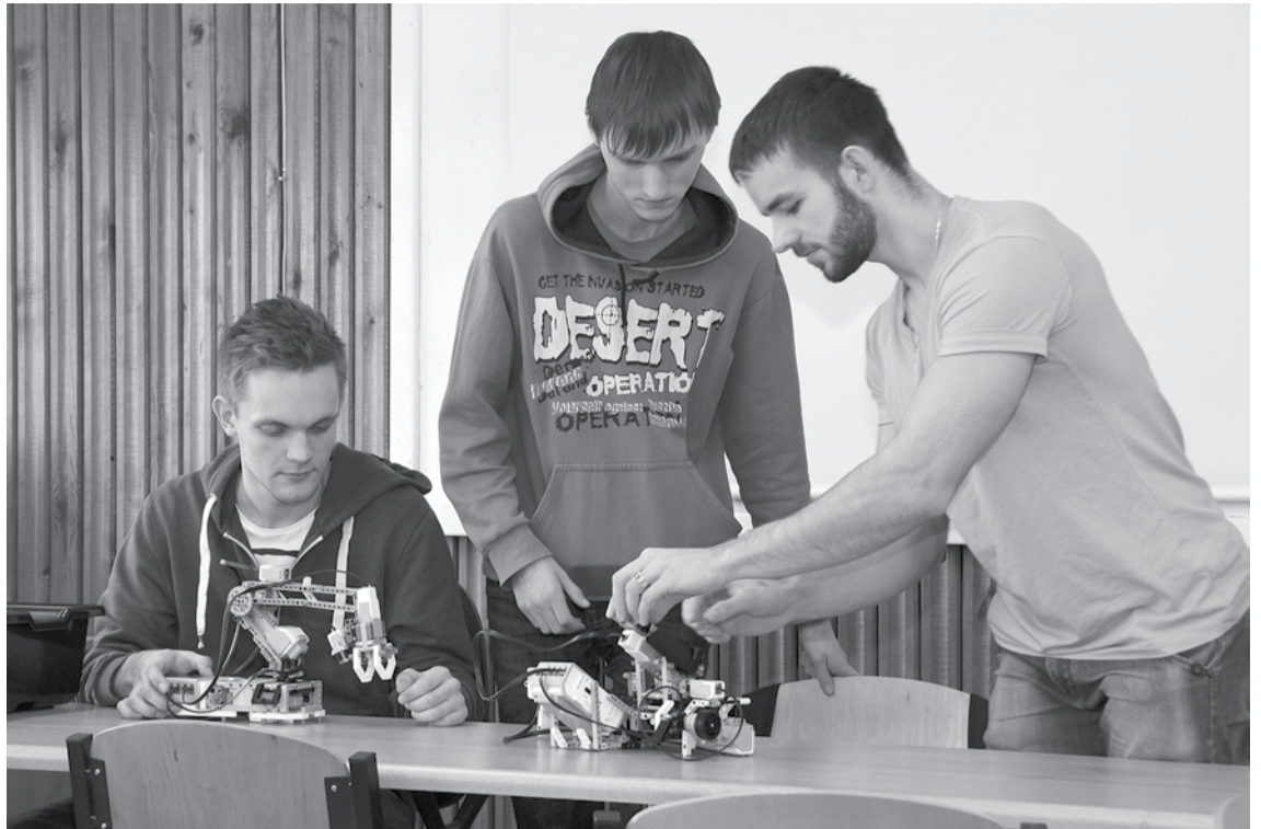
Robotikas pulciņa jaunieši gatavojas savām pirmajām sacensībām Siguldā.

Tāpat ģimnāzijā, ieviešot dažādus jauninājumus, nopietnu uzsvāru liek uz to, lai skolēni varētu labi apgūt modernās tehnoloģijas, kas