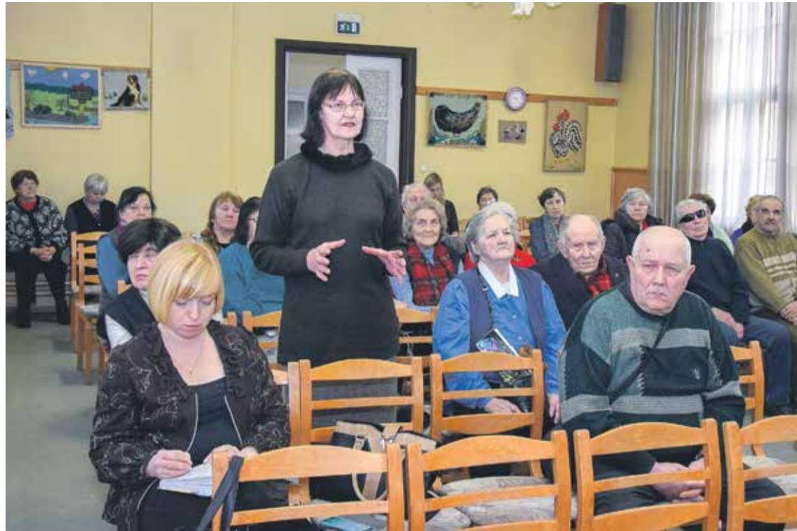
Seniori labprāt izmantoja iespēju iztaujāt pašvaldības vadību un speciālistus.

Sanākušajiem iedzīvotājiem aktuāls bija arī sabiedriskā transporta