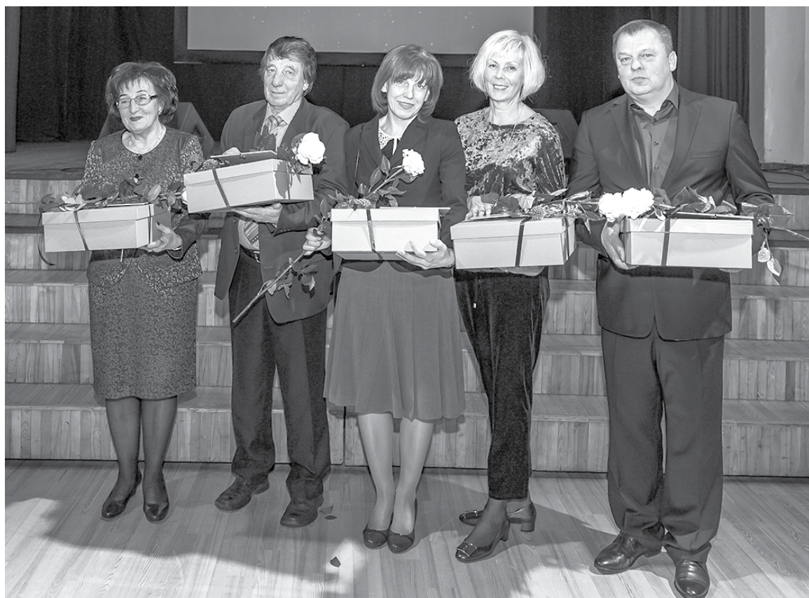
Nominācijā "Ilgspējīgākais uzņēmums" apbalvoja (no labās) kokmateriālu ražotāju un tirgotāju SIA "Mars", reklāmas pakalpojumu sniedzēju SIA "Dekors RD", laikrakstu "Kurzemnieks", veikalu "Dārziņš" un veikalu "Tīne".

SIGNETA LAPINA, sabiedrisko attiecību speciāliste