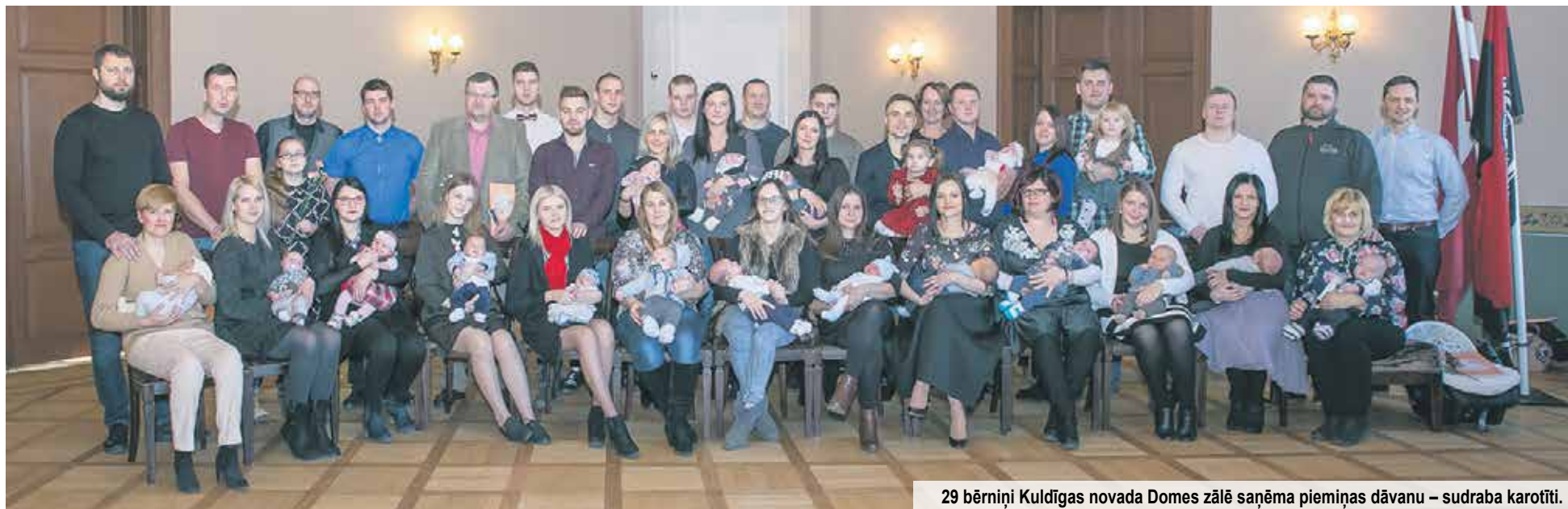
29 bērniņi Kuldīgas novada Domes zālē saņēma piemiņas dāvanu – sudraba karotīti.

Šī gada pirmajā sudraba karotīšu svinīgajā pasniegšanas pasākumā 16. janvārī pulcējās 29 bērniņi – 10 meitenes un 19 puīši ar vecākiem, vecvecākiem, brāļiem un māsām.