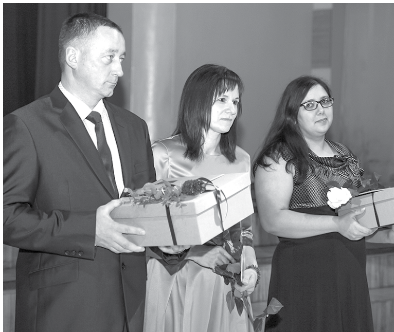
Sveica arī nominācijas "Gada jaunais uzņēmums" pārstāvjus - bērnu apģērbu šūšanas uzņēmumu SIA "ED Kriksis" un dzīvo muzeju "Senās Kuldīgas stāsts".