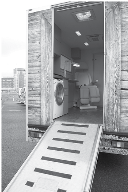
Latvijas Samariešu apvienība novada iedzīvotājiem turpmāk nodrošinās aprūpes mājās pakalpojumu, tai skaitā nokļūšanu uz pastu, veikalu vai citām institūcijām, kā arī veļasmašīnas, dušas un pēdu aprūpes iespējas speciāli aprīkotā transportlīdzeklī.

• pakalpojums "Drošības poga" – nepārtraukta saziņas iespēja, informatīvs atbalsts un palīdzība 24 stundas diennaktī. "Drošības poga" ir īpaša saziņas sistēma – saziņas iekārta un signālpoga, kas atrodas aprocē vai kulonā. Tā ir ērta lietošanā – atliek piespiest signālpogu un informēt par to, kas atgadīties. Signāls centrālē nonāk no jebkuras vietas dzīvoklī vai mājā. Vienlaikus ar signāla saņemšanu dienesta operatoram datorā redzama iepriekš apkopota informācija par personu – veselības stāvoklis, kontaktpersonas, kas palīdz operatīvāk un precīzāk nodrošināt palīdzību. Atbalstu var lūgt tieši tad, kad tas nepieciešams, un saņemt jebkurā laikā.