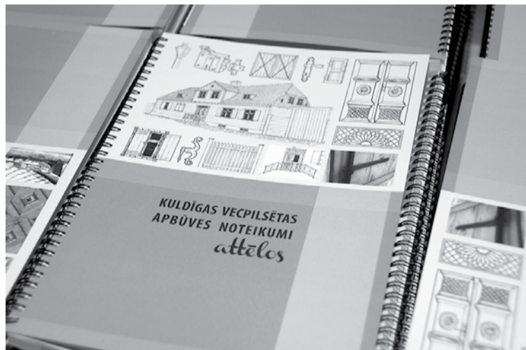
Tagad ikvienam pieejams pašvaldības veidots skaidrojošs materiāls vienkāršā valodā par apbūves noteikumiem vecpilsētā.

Kuldīgas vecpilsēta ieguvusi valsts nozīmes pilsētībūvniecības pieminekļa “Kuldīgas pilsētas vēsturiskais centrs” statusu, tāpēc nianšu un arhitektonisko vērtību skaidrošana ir viena no prioritātēm to saglabāšanā, kam Kuldīgas novada pašvaldība velta uzmanību. Lai informēšana notiktu pēc iespējas pilnvērtīgāk un vēsturiskā ēka tiktu uztverta kā vienota sistēma, izdevums “Kuldīgas vecpilsētas apbūves noteikumi attēlos” vienkāršā valodā un ar brīvu roku zīmētās skicēs skaidro specifiskos vecpilsētas apbūves noteikumus. Katra skice pa-