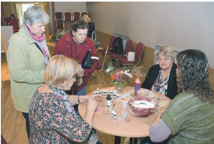
Smaržu terapijā Veselības dienas dalībnieki gatavoja roku skrubi.