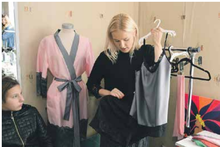
Kuldīgas uzņēmumā "ZigZag Factory" jaunieši iepazīna ražošanas procesus un uzzināja, kā nonākt līdz savam uzņēmumam.

Papildus novadā rīkotajiem pasākumiem arī katrā izglītības iestādē tika organizētas aktivitātes, kurās piedalījās novada skolēni. Viņi guvuši jaunu pieredzi, piedaloties gan radošajās darbnīcās, gan pildot Vīnes testu, kas paredzēts profesionālās piemērotības noteikšanai un apzinātas karjeras virzīšanai, gan iesaistoties spēlēs un konkursos, kā arī apmeklējot uzņēmumus un iepazīstot to darbu. Pie bērniem viesojās pat roboti Lenijs un Zipijs, lai novada trešklasniekus ievadītu programmēšanas pasaulē. Karjeras