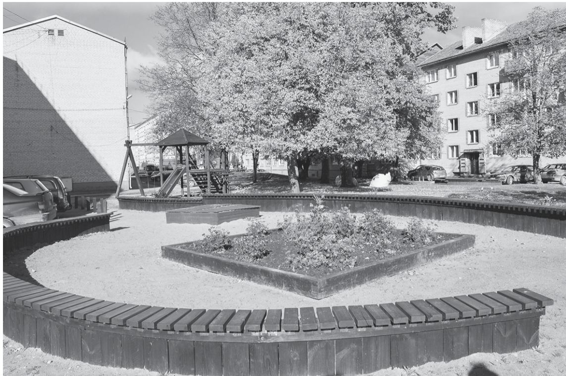
Grants ielas 29. daudzdzīvokļu nama iedzīvotāji labiekārtoja pagalmu, lai prieks pašiem un citiem.

Jau 11 gadus novada aktīvie iedzīvotāji pašu rokām daudz padara projektā “Darīsim paši”. Šogad konkurss noslēdzās 26. septembrī, realizēti tika 45 no 69 iesniegtajiem projektiem.