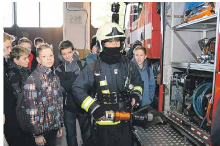
Skolēni, kuri viesojās Valsts ugunsdzēsības un glābšanas dienestā, iepazīs ar ugunsdzēsēju darbu un ietērpās arī glābēju tērpos.

to gadu organizē VIAA sadarbībā ar pašvaldību izglītības pārvaldēm. Tā notiek 25 Latvijas pilsētās un novados. To atbalsta Eiropas Komisijas programmas "Erasmus+" karje-