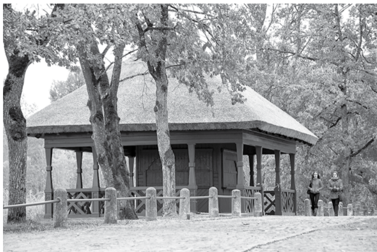
Rumbas kiosks restaurēts un atguvis vēsturisko izskatu.

Paviljona jeb tā saucamā Rumbas kioska sakārtošanas projekta galvenais uzdevums bija saglabāt pēc iespējas vairāk etnogrāfisko ēkas detaļu, tāpēc paviljons atguvis vēsturisko izskatu un atbilst sākotnējai iecerei ēku veidot senlatviskā stilā. Vēsturiskajā izskatā atjaunotās terases margas, renovētas inženierkomunikācijas, bet lietussūdens novadīšanas sistēma ierīkota tālāk no ēkas pamatiem. Atjaunoti arī logi un durvis, dēļu apšuvums paviljonam un mūra āršiena pagrabam ar dolomītkaļķakmens