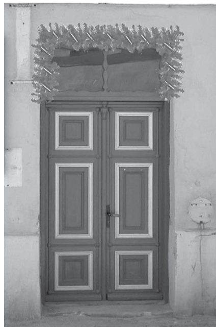
Kuldīgas novada pašvaldība aicina iedzīvotājus, uzņēmumu un iestāžu vadītājus ar prieku vītņēm izdekorēt ēkas.

Ar apstiprināto lokālpilnošanu var iepazīties Kuldīgas novada pašvaldības mājaslapā www.kuldiga.lv , interneta portālā www.geolatvija.lv un Kuldīgas novada pašvaldībā Baznīcas ielā 1, Kuldīgā.