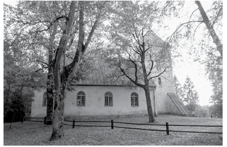
Īvandes luterāņu baznīca 22.–23. oktobrī svinēs 200 gadu jubileju.

Pašreizējā Īvandes luterāņu baznīca celta 1815. gadā muižas tuvumā ezera krastā, bet iesvētīta 1816. gada 12. novembrī. Līdz Pirmajam pasaules karam baznīcā darbojās gan vācu, gan latviešu draudze. 1936. gadā baznīcai uzlikts cinkota skārda jumts, ēka sakārtota, salabots altāris, kancele, soli. Kancele un altāris veidoti klasicisma stilā. Draudzes