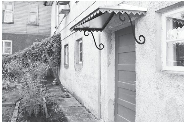
Kaļķu ielā 7, Kuldīgā iedzīvotāji sakārtoja mājas fasādi un izbūvēja uzjumteni virs ieejas durvīm.