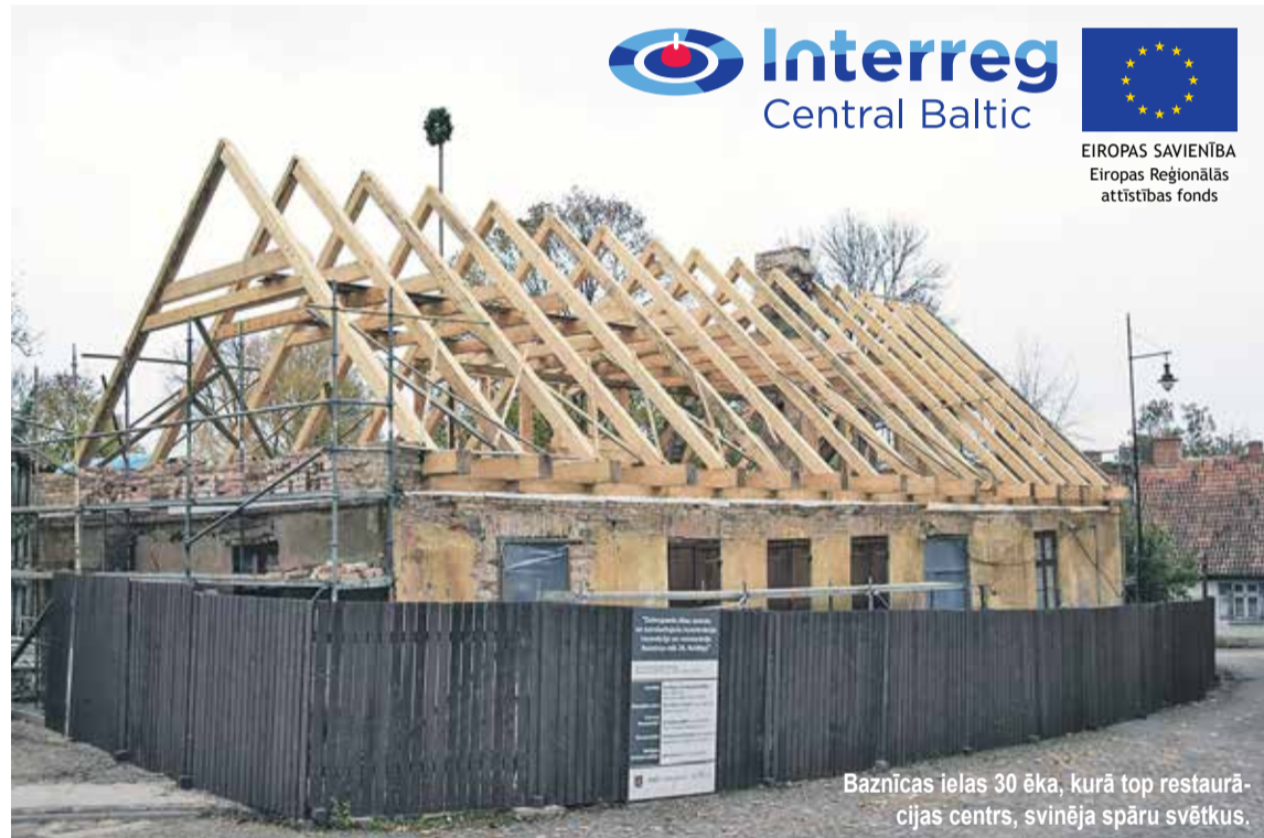
Baznīcas ielas 30 ēka, kurā top restaurācijas centrs, svinēja spāru svētkus.