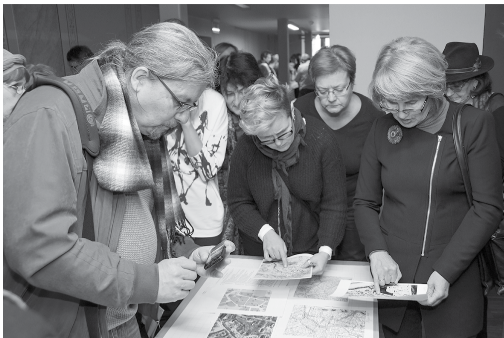
Arhitektūras dienu ietvaros dalībniekiem praktiskajās darbnīcās bija jāgatavo priekšlikumi degradēto teritoriju iekļaušanai un atjaunošanai vēsturiskajā vidē.