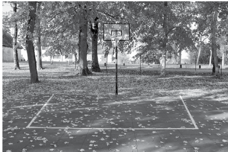
Padures pagastā grupa “Savējie” izveidoja sporta laukumu brīvā laika pavadīšanai.