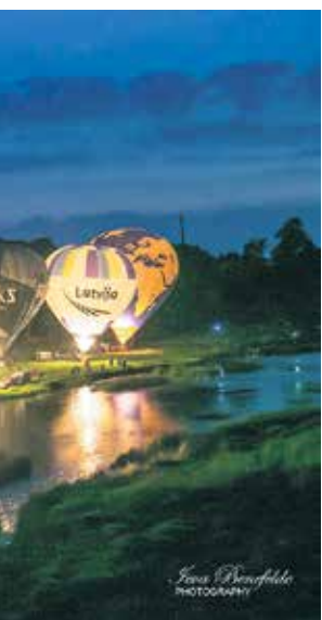
...un Vislatvijas tvīda brauciens ...ilais karogs, apliecinot ūdens