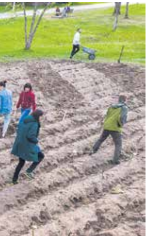
...dīdzniekiem Pārventas parkā ...u lauka radio.