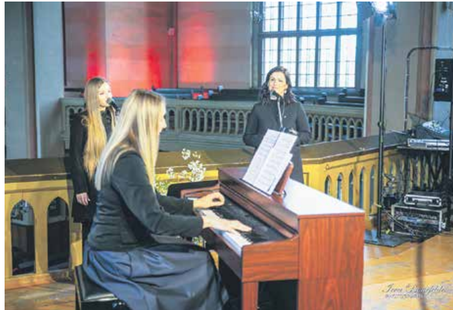
Kuldīgas trio un E. Vīgnera Kuldīgas mūzikas skolas pedagogi, kuru uzstāšanās notika 4. maijā, Latvijas Republikas Neatkarības atjaunošanas dienā, klausītājiem piedāvāja programmu valsts svētku noskaņās.