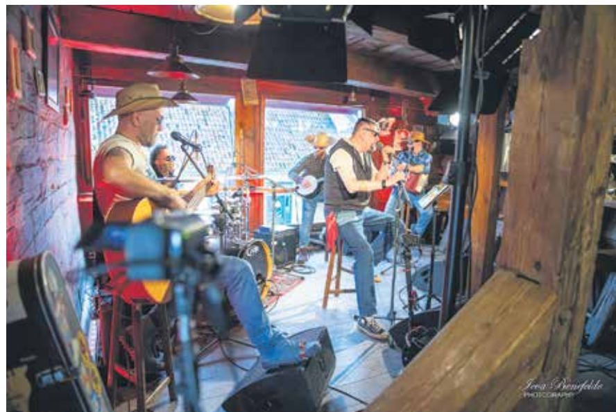
Grupai "Montana" bija gods atklāt Kuldīgas vecpilsētas koncertzāles koncertu sēriju. Viņi uzstājās bārā-klubā "Stenders".