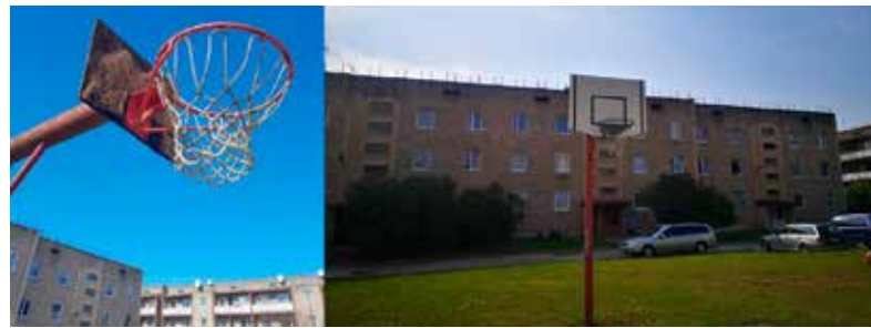
Atsaucoties iedzīvotāju lūgumam, daudzdzīvokļu māju iekšpagalmā atjaunots basketbola grozs ar vairogu.