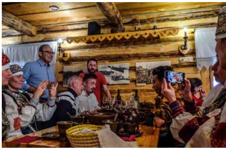
Biedrības "Etniskās kultūras centrs "Suiti"" īsteno starptautiskā projekta partneri maija beigās klātienē tikās īstermiņa kopīgās personāla apmācībās Igaunijā, Kihnu salā un Setu novadā.

Galvenais projekta mērķis tiks sasniegts ar dažādu aktivitāšu palīdzību. Lai dalītos ar metodēm, pieejām un labās prakses piemēriem starp partnerorganizācijām un valstīm, projektā īsteno septiņus īs-