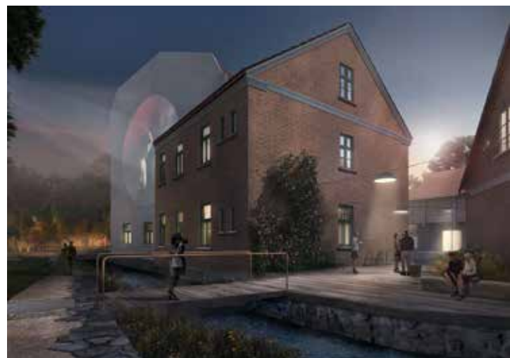
SIA "MARK arhitekti" vizualizācija

Kuldīgas kultūras centra ēka savulaik celta kā Kuldīgas sadraudzīgās biedrības nams. Gadu gaitā ēkas būvsubstanci papildinājuši uzslāņojumi, taču saglabāta šarmantā un panaivā, robustā un unikālā mazpilsētas jūgendstila valoda. Kā norāda SIA "MARK arhitekti", Kuldīgā jū-