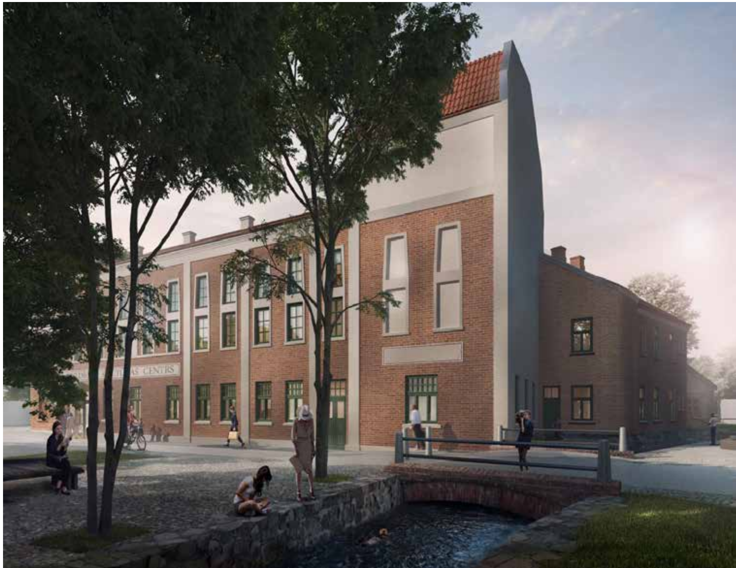
Ēka Raiņa ielā 21 savulaik celta kā Kuldīgas sadraudzīgās biedrības nams. Tas ir viens no retajiem namiem pilsētā, kas veidots Jugendstilā. Namu atjaunos nepilnu divu gadu laikā.