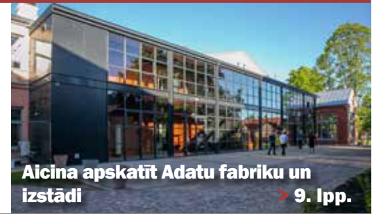
Aicina apskatīt Adatu fabriku un izstādi > 9. lpp.