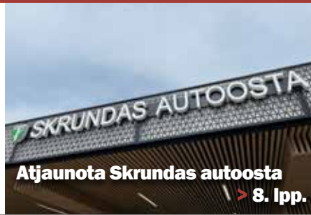
Atjaunota Skrundas autoosta > 8. lpp.