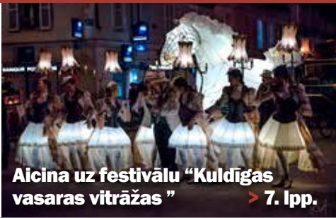
Aicina uz festivālu "Kuldīgas vasaras vitrāžas" > 7. lpp.