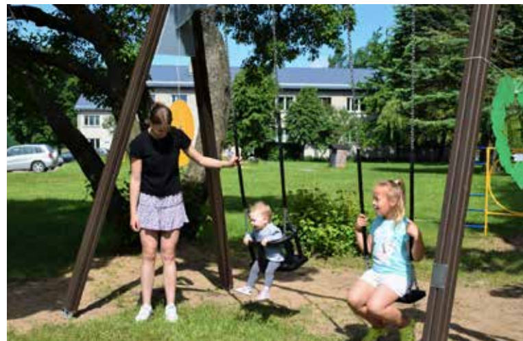
Nīkrācē par pašvaldības līdzekļiem uzstādītas šūpoles, kuras iedzīvotāji jau izmēģinājuši un atzinuši par labām.

Nīkrācē šūpoties gribētāju nekad nav trūcis, un tas apstiprinājās arī atklāšanas pasākumā, kurā šūpoties gribētāji jau bija nepacietīgi stājušies rindā, lai izmēģinātu jauno rotaļu elementu. Vietējo ekspertu vērtējums viennozīmīgs – labas gan!