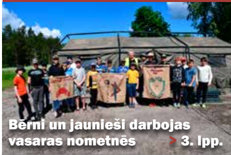
Bērni un jaunieši darbojas vasaras nometnēs > 3. lpp.