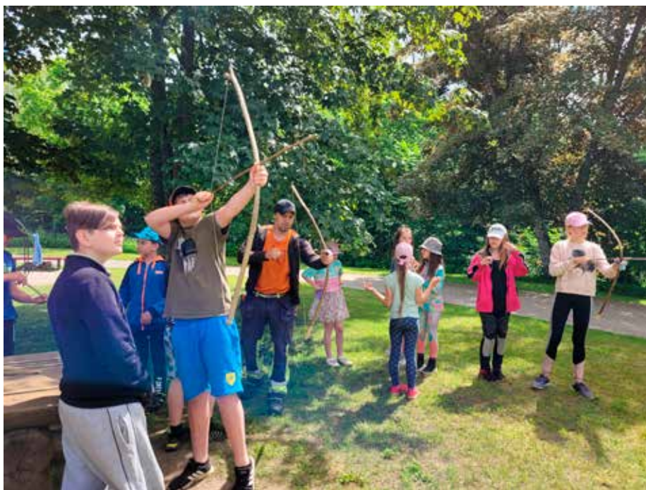
Nometnes “Praktiskās dzīves skola” dalībnieki mācījās šaut ar loku.