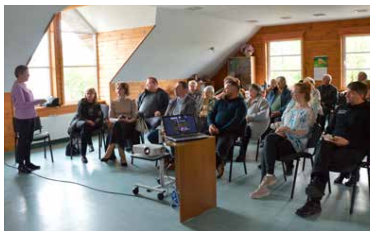
Rumbas pagasta iedzīvotāju sapulcē izskanēja jautājumi par atkritumu un īpašumu apsaimniekošanu, kā arī latvāņu apkaršanu.

Kādam iedzīvotājam bija jautājums par atkritumu novietni Mežvaldē pie "monstra". Esot bardaks, vieta nekopta, pavasarī atkritumu izvedējs izbrou-