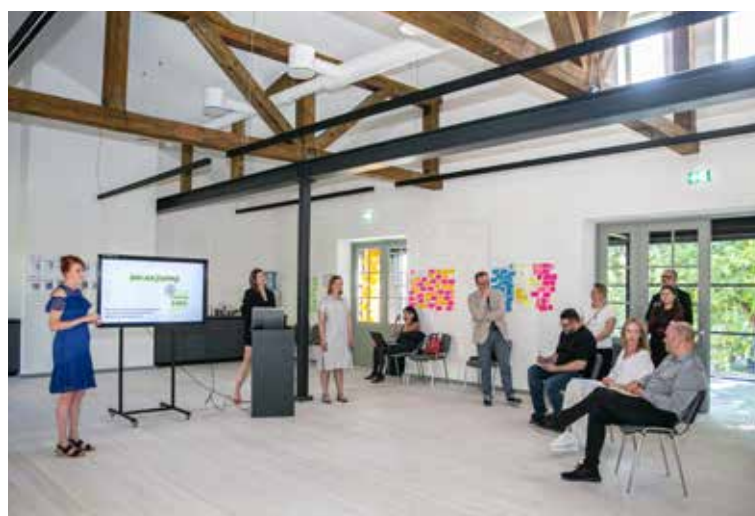
Pirmie seši pakalpojumu dizaina maģistra programmas studenti no Latvijas, Taivānas un Somijas studiju gadu noslēdza ar prezentācijām jaunajās telpās. No studentiem saņemtas pozitīvas atsauksmes. Otro studiju gadu viņi turpinās Lapzemē.

Latvijas Mākslas akadēmija ar Eiropas Sociālā fonda atbalstu izstrādājusi un 2021. gadā licencējusi pirmo pakalpojumu dizaina studiju programmu Baltijas valstīs “Pakalpojumu dizaina stratēģijas un inovācijas”. Programma ir starptautiska un tiek īstenota četru augstākās izglītības institūciju – Latvijas Mākslas akadēmijas, Lapzemes Universitātes, Rīgas ekonomikas augstskolas un Igaunijas Mākslas akadēmijas – sadarbībā. Studijas norisinās angļu valodā.