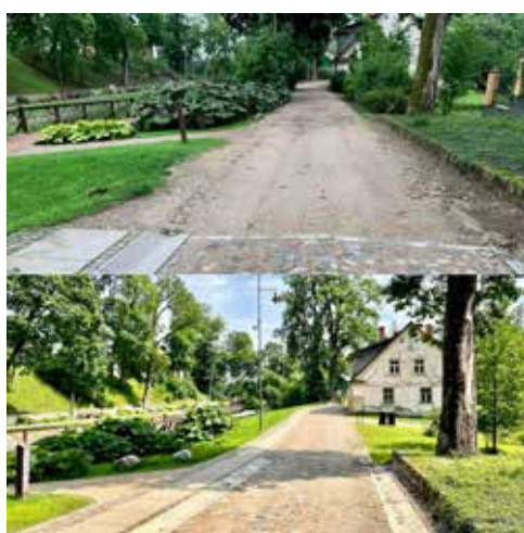
Noslēgsies brauktuves seguma un ietvju pārbūve Pils un Dīķu ielas posmos. Segumā izmantots senais akmens bruģis, kas savulaik atrasts, pārbūvējot 1905. gada ielu. Attēlā – Dīķu ielas posms pirms un pēc pārbūves.

VELGA SILIŅA, projektu vadītāja