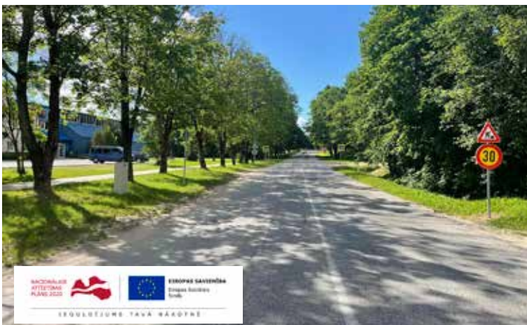
Sākusies piecu ielu pārbūve Kuldīgas austrumu daļā, uzlabojot un izbūvējot šajā pilsētas daļā nepieciešamo satiksmes infrastruktūru, padarot to ērtāku gājējiem, velosipēdistiem un autovadītājiem, kā arī veicinot jaunu darba vietu rašanos.

Projekta mērķis ir revitalizēt Kuldīgas pilsētas austrumu daļas degradēto teritoriju 6,1 hektāru platībā, ko kuldīdznieki pazīst kā Lauktechnikas apkaimi, uzlabojot un izbūvējot šajā Kuldīgas daļā nepieciešamo satiksmes infrastruktūru, padarot to ērtāku gājējiem, velosipēdistiem un autovadītājiem, kā arī veicinot jaunu darba vietu rašanos.