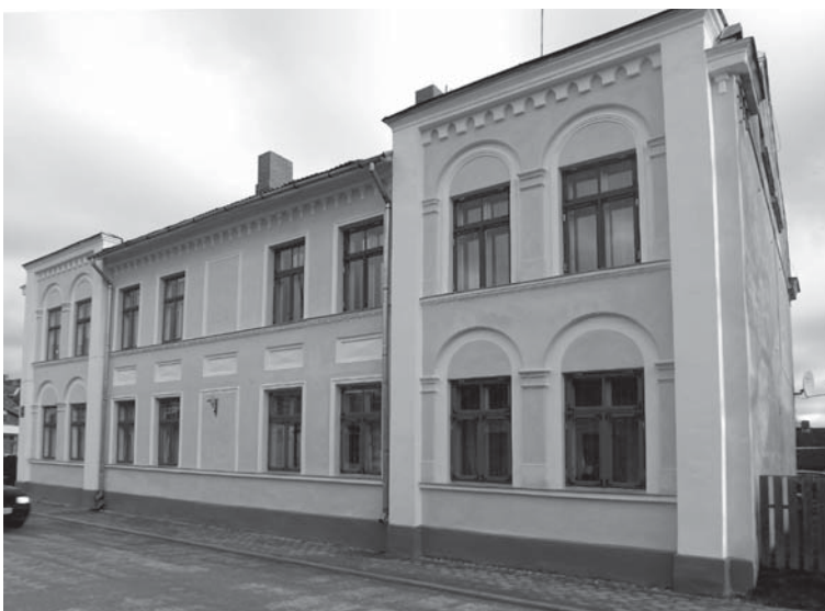
Dzirnavu ielas 4. nama iedzīvotāji lepojas ar skaistās fasādes atjaunošanu.