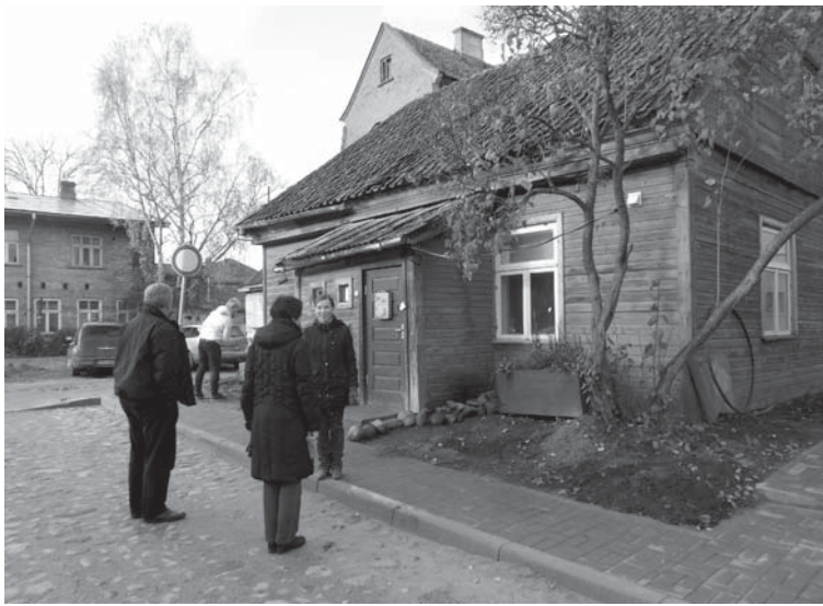
Biedrība „Sauls sala” Liepājas ielā 8 sakopusi apkārtni pie biedrības telpām, daļēji nobruģējot arī gājēju celiņu pie ēkas.

„Darba rūķis”. Lipaiķu evaņģēliski luteriskā draudze ir pārveidojusi bijušo gāzes balonu noliktaavu un ierīkojusi brīnišķīgu rūķu māju: sienas apšūtas ar kokmateriāliem gan no iekšpuses, gan ārpusē, ir izlīdzināta grīda. Uzlabota arī mājiņas apkārtnē – vecajā parkā izveidotas jaunas takas un ierīkoti