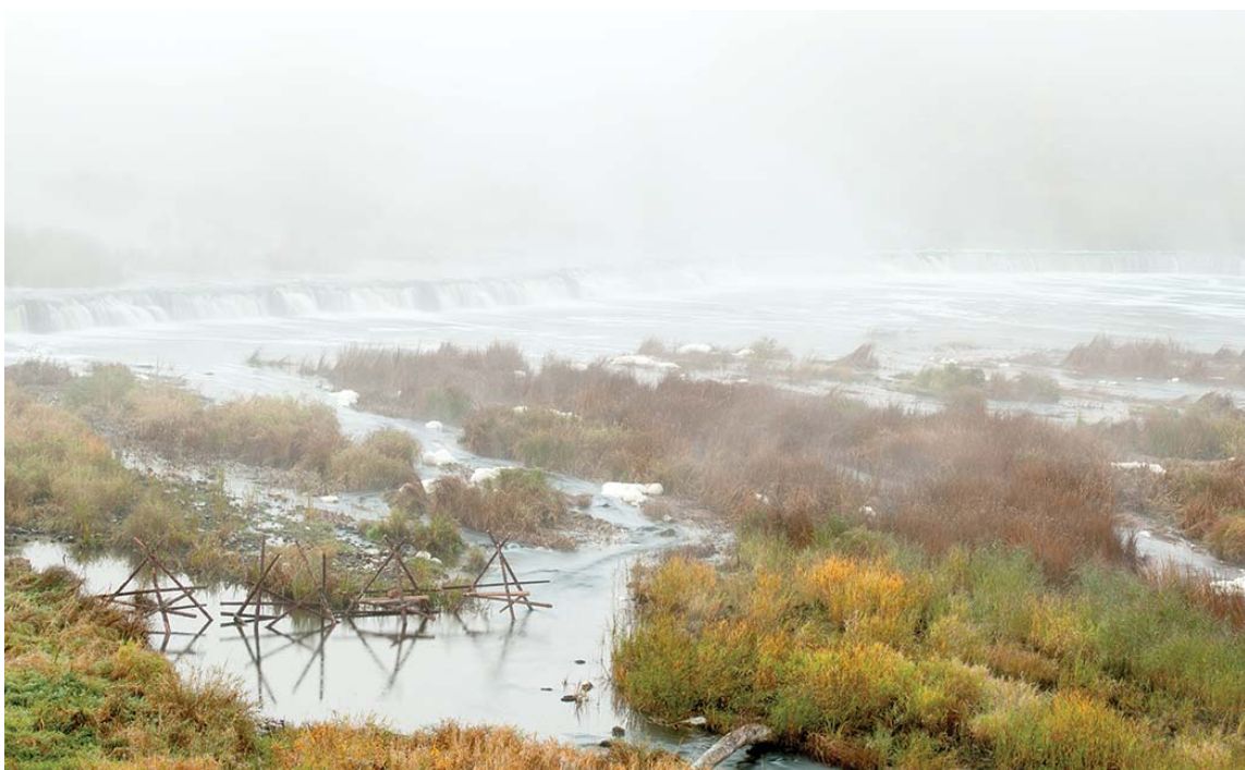
Uzstādītie nēģu tači pēc to vēsturiskajām konstrukcijām.

Uzņēmumiem – SIA „GK Auto” un biedrībai „Kurlande” rūpnieciskās zvejas tiesību nomas līgums beigsies 2013. gada 31. decembrī. Zvejnieki jau ņēmuši vērā, kādiem būtu jāizskatās nēģu tačiem, un biedrība „Kurlande” jau konstrukcijas ir uzstādījusi.