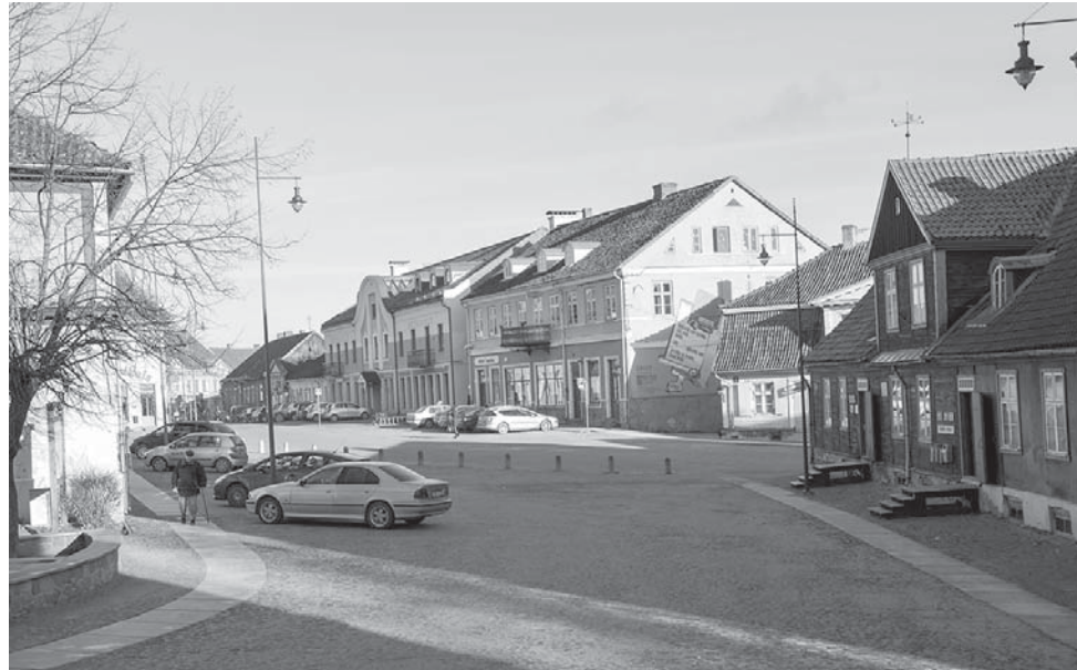
Kuldīgas „Venēcijas” projektā vecpilsēta maksimāli pietuvināta veidolam, kāda tā vēsturiski bijusi – pazemināts ielu līmenis, izveidots šķeltā bruģa segums, iekārtoti apstādījumi.

Projektā „Kuldīgas „Venēcijas” – Alekšupītes un ar to saistīto ielu un laukumu kā pievilcīgas dzīves telpas un ekonomiskās attīstības teritorijas izveide, 1. kārtā” (nr. 3DP/3.6.1.1.0/12/IPIA/VRAA/001/076) ir veikta ielu, tiltu, skvēru un laukumu vēsturiskā izpēte un rekonstrukcija, radot kvalitatīvu dzīves telpu un pievilcīgu teritoriju ekonomiskajai attīstībai un tūristu piesaistei, vienlaikus nodrošinot kultūrvēsturiskā mantojuma saglabāšanu.