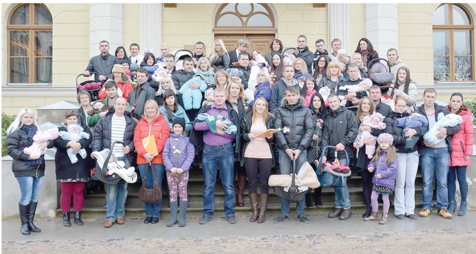
Šoreiz sudraba karotītes saņēma 30 jaunākie novadnieki, kuri dzimuši septembrī un oktobrī.

Uz pasākumu bija aicināti 46 bērniņi. Kopā ar mammām, tētiem, radiem un draugiem bija ieradušies un sudraba karotītes ar iegravētu novada ģerboni un gada skaitli saņēma 30 mazuli. Pasākumu ar skaistām dziesmiņām kuplināja Kuldīgas PII „Bitīte”-attīstības centra audzētāji.