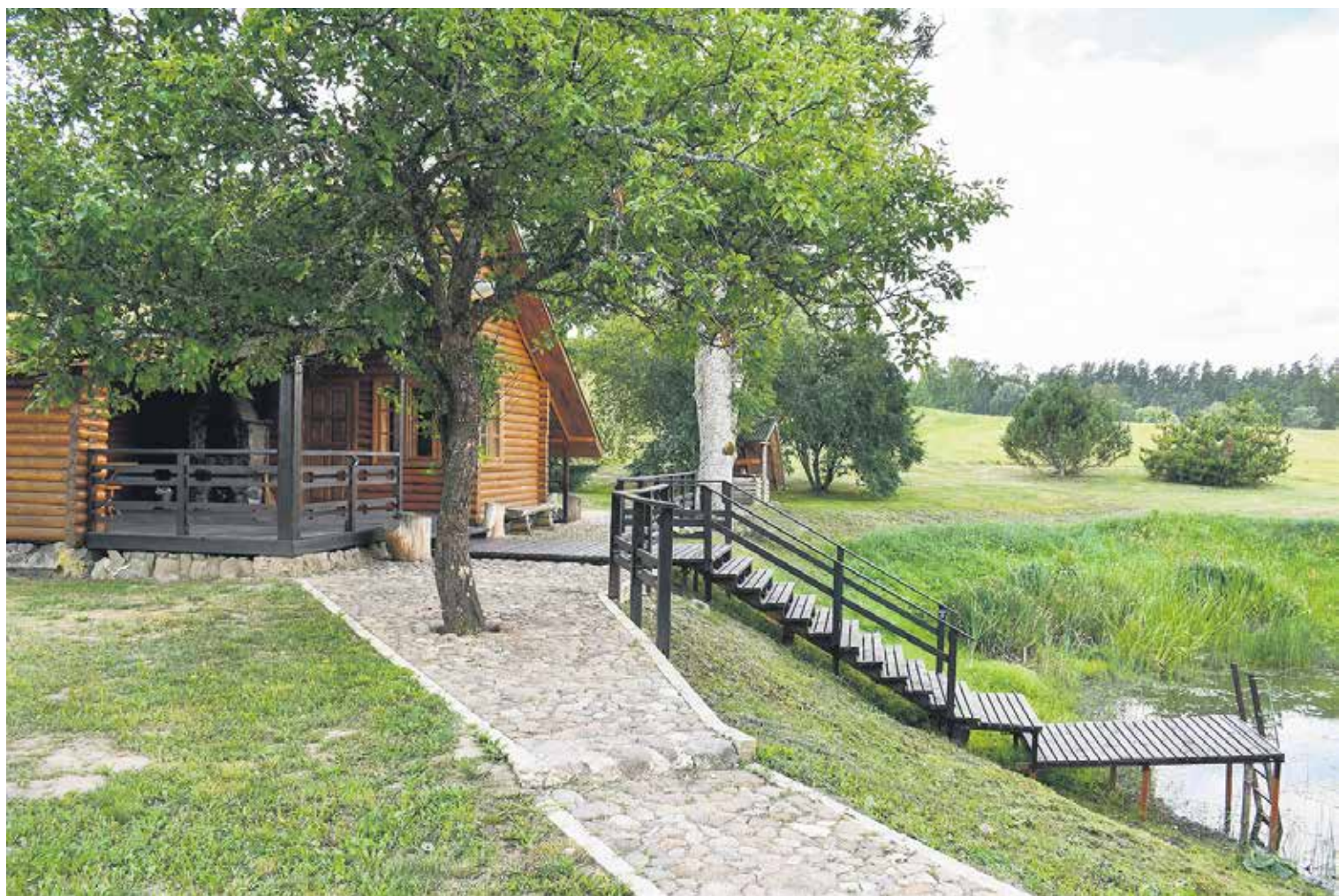
Ēdoles pagasta "Plaču" saimniecība ir liela – dzīvojamā māja, pirts, laivu māja, pat maza estrāde. Villjamu ģimenei visu izdodas uzturēt pilnīgā kārtībā.

Piemājas teritorija, dārzs vai sēta – viss prasa rūpes un strādīgas rokas. Kuldīgas novada sakoptāko lauku sētu saimnieki atzīst, ka viss galvenokārt tiek darīts pašu priekam.