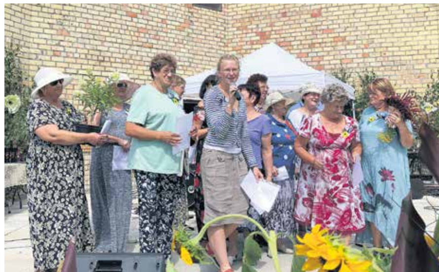
Senioru saietā sevi pieteica arī viesi no Rumbas pagasta.

4. augustā Kurmāles pagasta Vilgāles estrādī piepildīja 370 seniori, kuri bija ieradusies no Kuldīgas, Skrundas un Alsungas novadiem 18. starpnovadu senioru saietā.