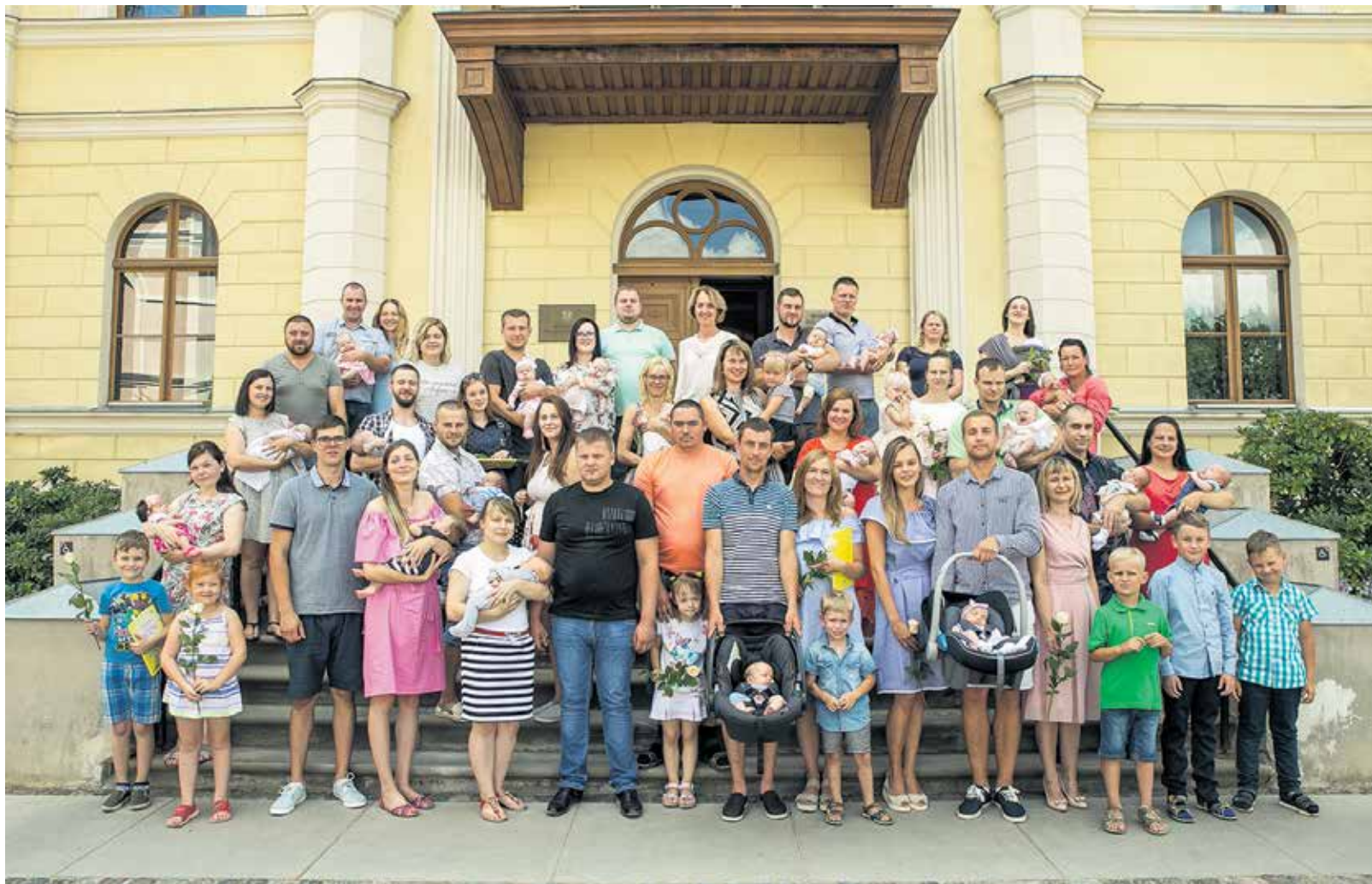
40 mazuļi saņēma piemiņas dāvanu – sudraba karotīti – un kopīgi fotografējās pie Kuldīgas novada Domes.