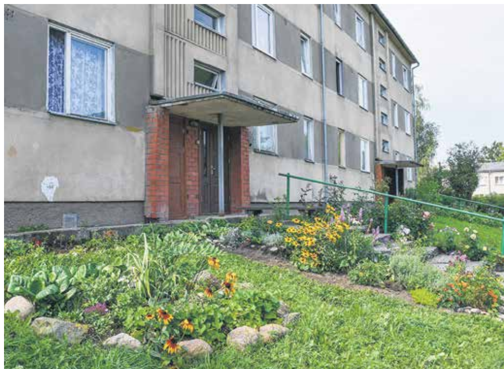
Ventas ciema daudzdzīvokļu nama "Ventenieki" ieejas rotā krāšņi ziedošas puķu dobis. Par tām ikdienā rūpējas mājas iedzīvotāji.