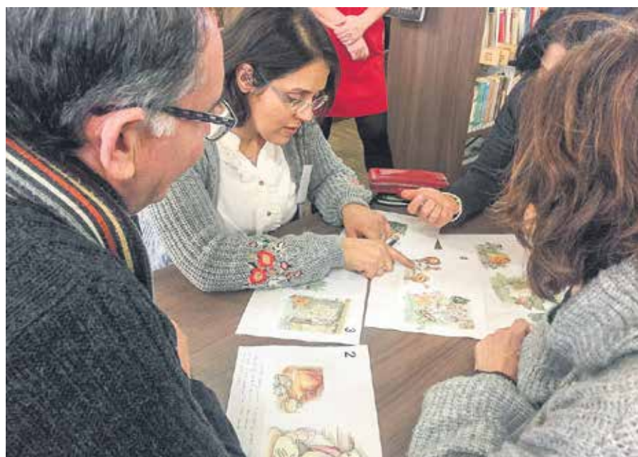
Erasmus Plus projekta "European Tales are Coming together" dalībnieki no Turcijas un Spānijas Kuldīgas Galvenajā bibliotēkā veido savu pasaku pēc latviešu tautas pasakas "Kukulītis" attēla.

Lai parādītu Kuldīgas unikālās vērtības, nākamajā dienā projekta dalībnieki devās atraktīvā ekskursijā pa vecpilsētu un jautrā foto-rallijā centās atpazīt pilsētas senās ēkas. Bet pēc tam devās uz veco rātsnamu, kur mākslinieces Aigas Vaitkus vadībā īpašā nodarbībā apguva zīmēšanas iemaņas un gleznās iemūžināja pilsētas ainavu.