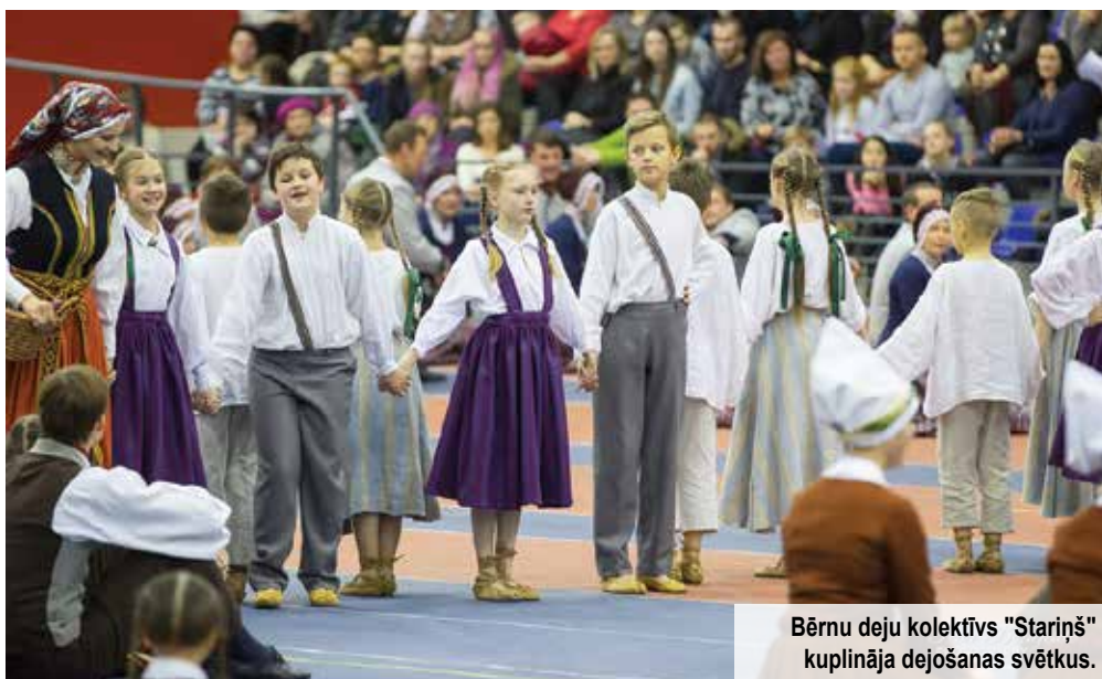
Bērnu deju kolektīvs "Stariņš" kuplināja dejušanas svētkus.