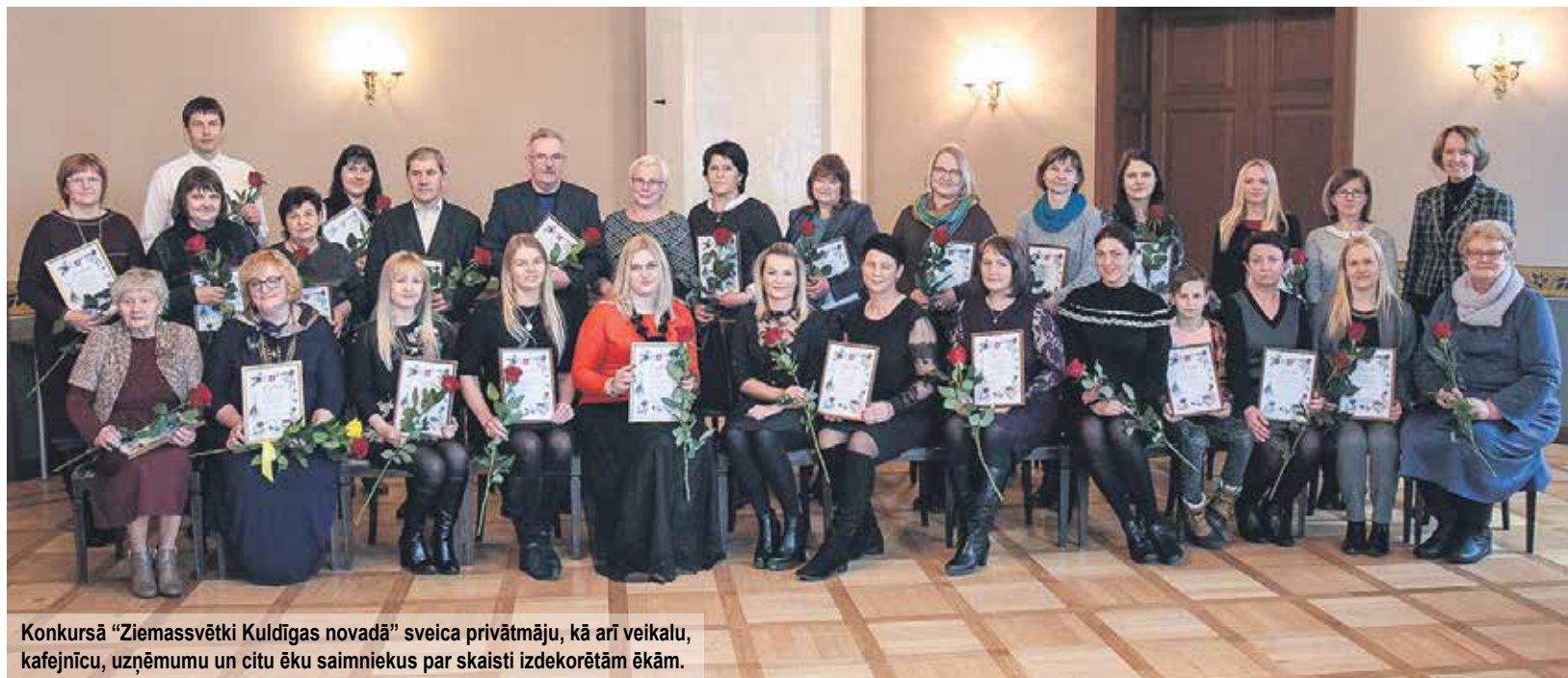
Konkursā "Ziemassvētki Kuldīgas novadā" sveica privātmāju, kā arī veikalu, kafējnicu, uzņēmumu un citu ēku saimniekus par skaisti izdekorētām ēkām.