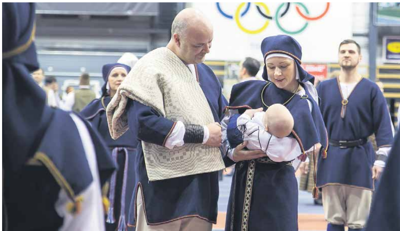
Kolektīvs "Bandava" deļā "Pa sauli, pret sauli pādīti dīdu", iesaistot mazuli, radīja reālu noskaņu un dejas ideju.