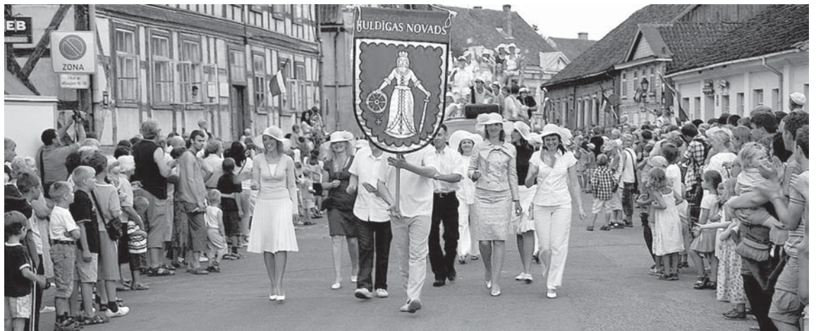
Ik gadu Kuldīgā pulcējas milzum daudz ļaužu, lai noskatītos Lielo svētku gājienu.