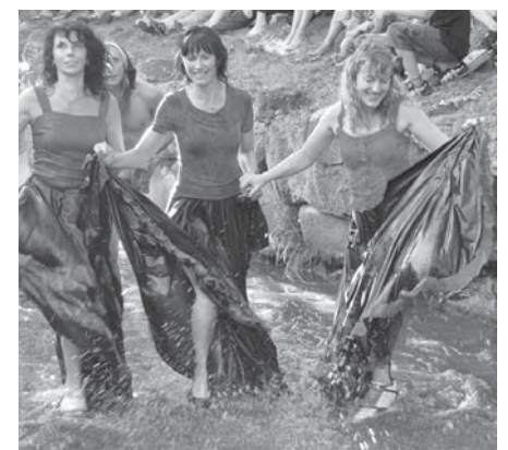
Jautrais un krāšņais Alekšupītes karnevāls liecina, cik izdomas bagāti un svētkus mīloši ir Kuldīgas novada iedzīvotāji.

kuldīdznieces no Latvijas baleta trupas. Savukārt par smaržu kon-