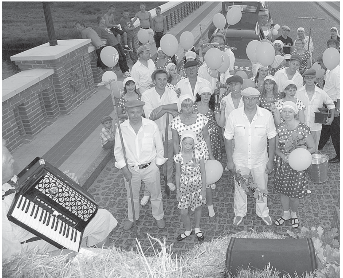
Kuldīgas novada Dome pateicības balvu par rūpīgi pārdomāto noformējumu svētku gājiena pasniegza SIA "Amazone".