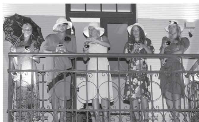
Pēc pusnakts vecpilsētā ikviens varēja kļūt par liecinieku Kuldīgas balkonu stāstiem.