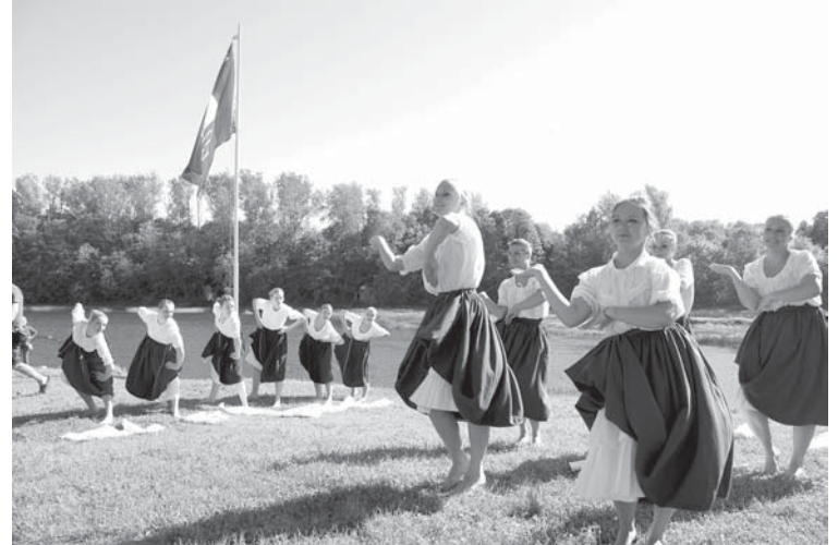
Klātesošos priecēja Kuldīgas jauniešu teātris „Focus” ar dejām (attēlā) un popgrupa „Putiņas” ar dziesmām.