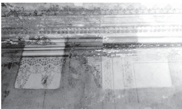
Attīrītais kontrollaukums atklāj sienas un griestu ieloces dekoratīvo krāsojumu. Sienas augšējā daļā pa visu telpas perimetru iet plata, stilizēta augu un abstrakta ornamenta josla. Sienas pamattonis ir gaiši zaļš.