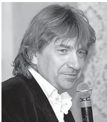
Pasākuma viesis – Latvijas Neatkarīgās televīzijas īpašnieks Andrejs Ēķis runāja par nacionālajām interesēm.