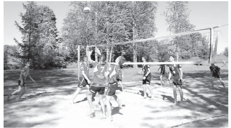
Kuldīgas novada sporta skolas audzēkņi – Latvijas čempioni volejbolā pasākumā demonstrēja spraižu zvaigžņu spēli.