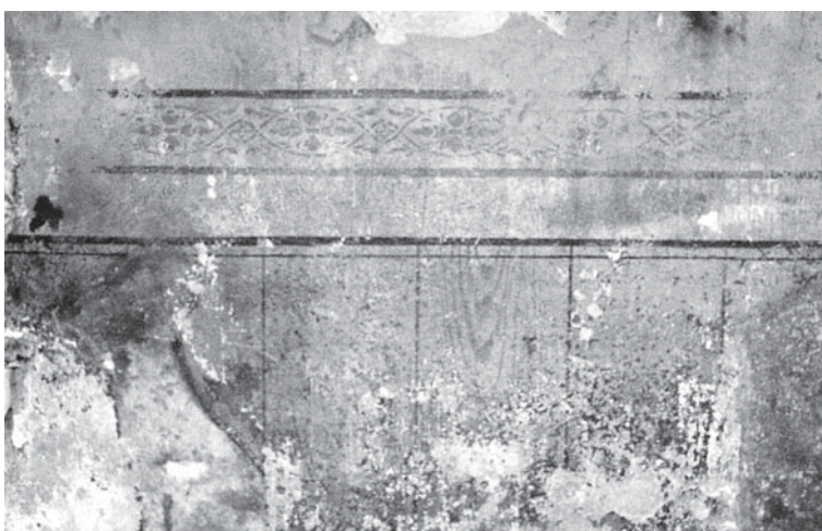
Gaiši zilo sienas plakni 106 cm no grīdas noslēdz iluzors dekoratīvs koka imitācijas paneļa krāsojums ar ~30 cm platu dēļu dalījumu.

Kuldīgas novada Domes speciālisti lems par atklāto zīmējumu saglabāšanu un restaurāciju, norā-