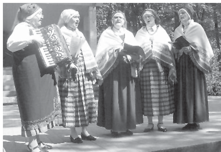
Kuldīgas kultūras centra folkloras kopa „Nārbuli” atsauksies draudzīgajam kaimiņu aicinājumam.

Kaimiņu dienas aizsākušās Francijā, kad 1990. gadā tika izveidota domubiedru asociācija, lai mobilizētu cilvēkus rīkoties pret