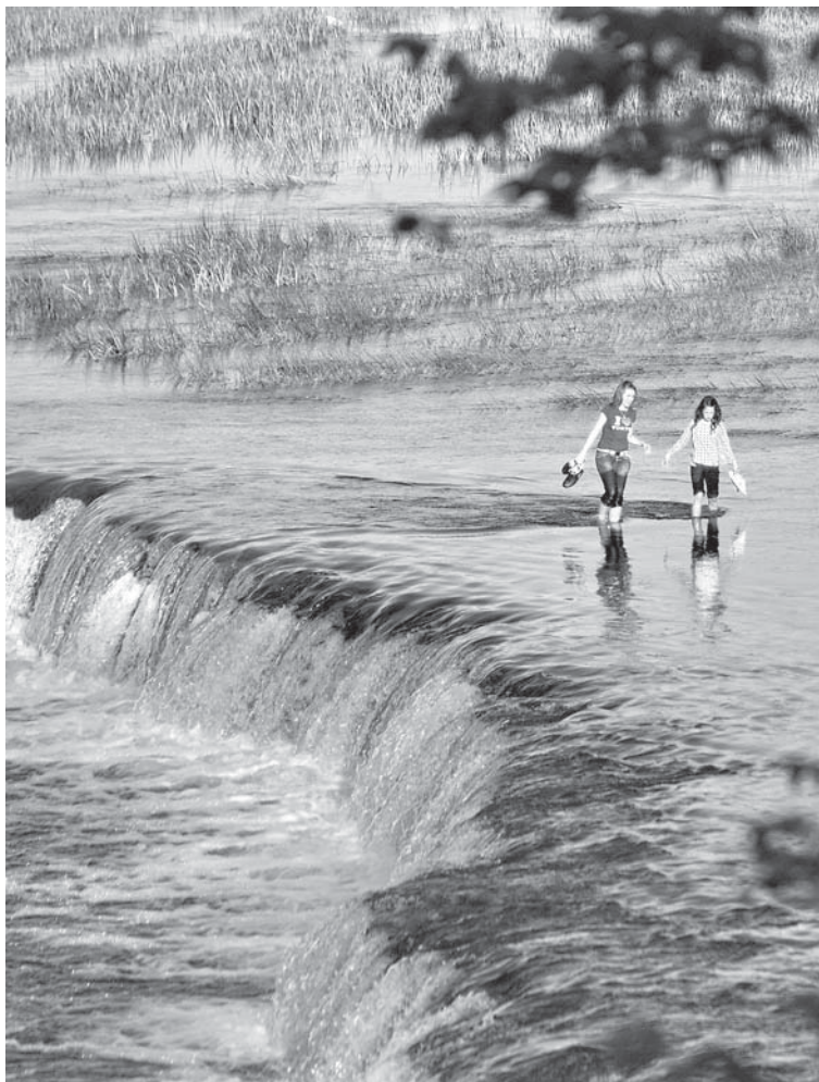
UNESCO kultūras mantojuma sarakstā iekļaut Riežupes smilšu alas un unikālos atsegumus – tukšneša veidojumus – Ventas lejtecē