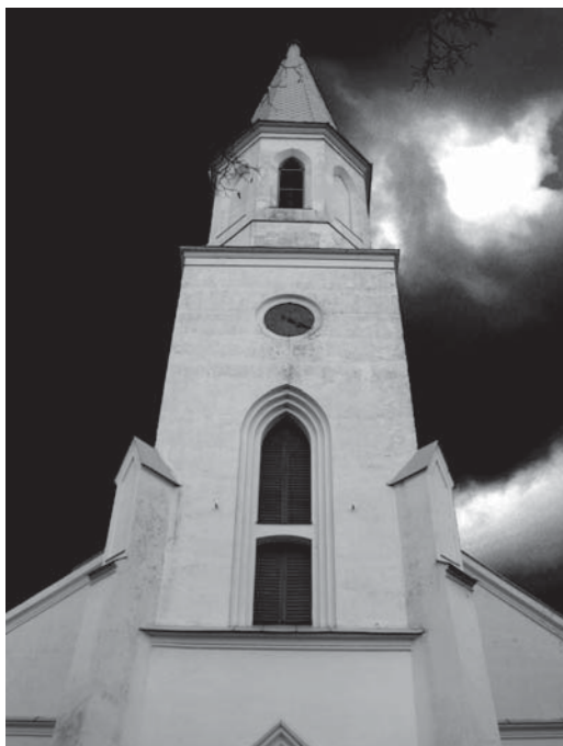
Uzdevums: krāsains akcents melnbaltā attēlā. Fotosesija Kuldīgas vecpilsētā. Adobe Photoshop. Krāsainam attēlam izveido melnbaltu masku, izdēš vietas, kuras vēlas krāsainas.