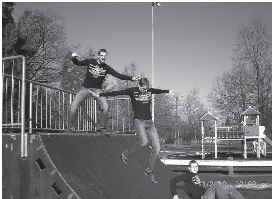
Uzdevums: fotokolāža – Es Kuldīgā. Adobe Photoshop. Veido kompozīciju, kur ievietotas figūras no dažādiem attēliem. Izmanto dažādus izgriešanas instrumentus.