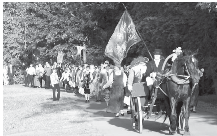
Noslēguma koncertā visi kolektīvi devās gājienā no Kārja laukuma uz estrādi, priekšgalā zirga pajūgā brauca pats hercogs Jēkabs.

Koncertā „Hercogs Jēkabs piestāj baznīcā”, kas norisinājās Sv. Miķeļa baznīcā, tika paziņoti kon-