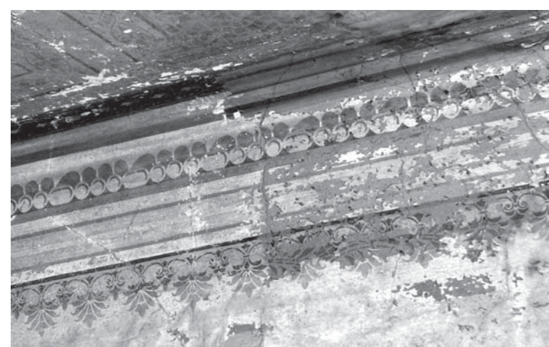
Saglabājies dekoratīvais ziedlapu formas krāsojums. Iluzoru dzegas profilu grezno uzgleznota pērļu josla. Pērles krāsotas baltā tonī ar brūnu ēnojumu. Dekoratīvo iluzoro dzegas profilu gleznojumu papildina plakana ornamentu josla ar lazētām oranži brūnām palmetēm griestos.

liela telpa ar akcentētu centru griestos. Telpā uz ziemeļu sienas redzami balkona malas un solu profilu nospiedumi. Izpētē secināts, ka balkons aizņēmis visu rietumu sienas daļu un daļu dienvidu sienas. Balkona zona aizņem vienu trešo daļu no telpas. Šāds izkārtojums ar balkonu vairāk atgādina tipisku sinagogas plānu, kurā sievietēm