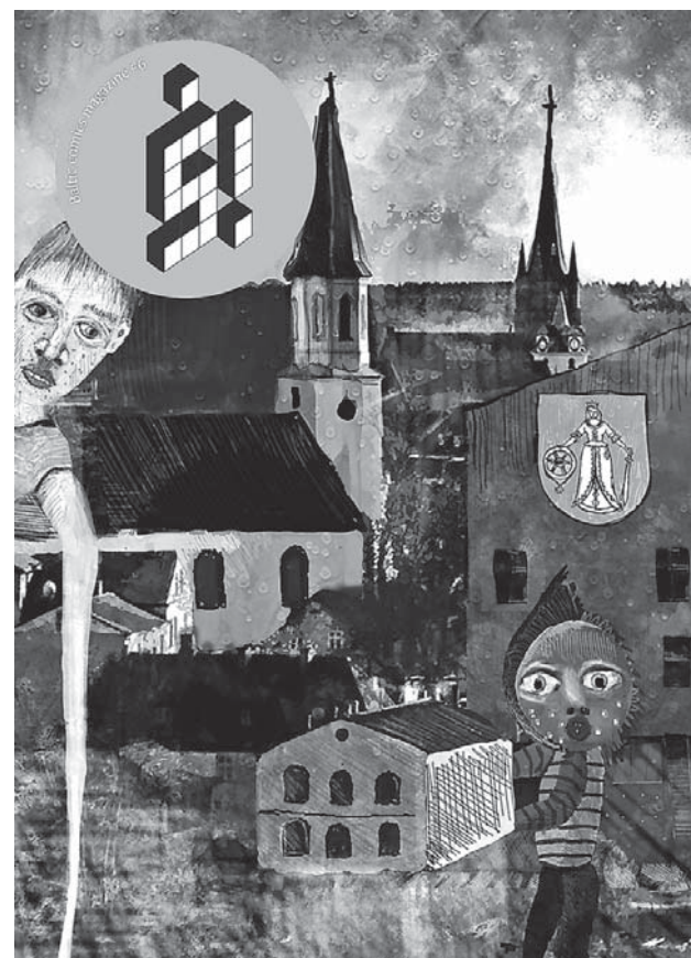
Jūnija numurs ir 64 lappušu biezs, un tas latviešu un angļu valodā stāsta par Kuldīgu un ir kā veltījums hercoga Jēkaba 400 gadu jubilejai.

„Kuš!” tapis ar Kuldīgas novada Domes atbalstu. Kuldīgā būs pieejami 1000 žurnāla eksemplāru, un tos par Ls 1,20 var iegādāties ikviens interesents, tā atbalstot Latvijas Mākslas akadēmijas studentu plenēru, kas no 10. līdz 20. jūnijam notiks Kuldīgā, bijušās slimnīcas ķirurģijas nodaļas telpās.