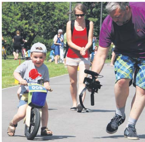
Jau otro gadu notika dip-dap skrejriteņu sacensības 2 – 5 gadus veciem bērniem, šogad startēja vairāk nekā 30 dalībnieku.

Velodienas organizēja Kuldīgas Aktīvās atpūtas centrs sadarbībā ar Eiropas Komisijas pārstāvniecību Latvijā, Kuldīgas novada Domes un SIA „Velokurjers”. Pasākumu atbalstīja Kuldīgas novada Sporta skola, www.veloatlaides.lv, Kuldīgas Maizes ceptuve, SIA „Druvas saldējums”, SIA „Linde pārtika” veikals „Elvi”, „MGS Factory”, „Stender’s pica”, SIA „Vēvers”, SIA „Mars”, „Ramirent Baltic” AS Rīgas filiāle, SIA „PC Konsultants” u. c.