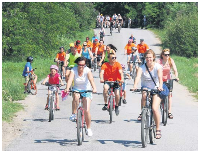
Dalībnieki devās vienā no četru dažādu garumu maršrūtiem Pelču, Snēpeles un Vilgāles virzienā.