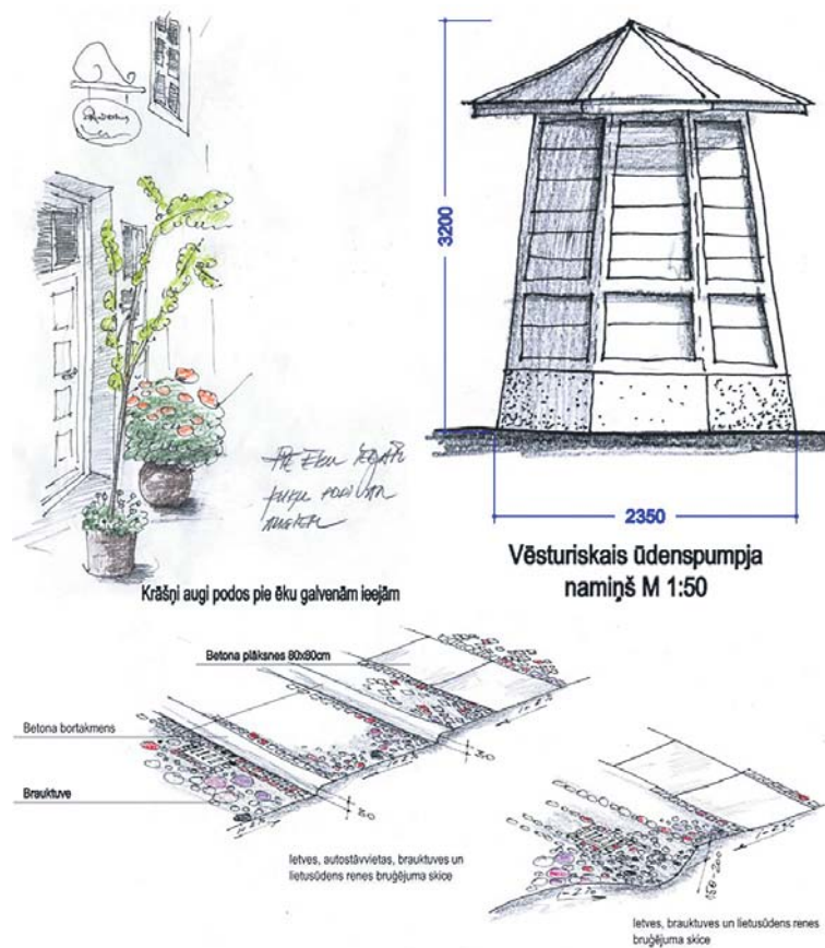
Projekts – vīzija „Ielu telpu restaurācija Kuldīgas vecpilsētā” saņēma Arhitektūras gada balvu – ananasa šķēli un diplomu.

Latvijas Arhitektūras gada balva ir ikgadējs konkurss, kura mērķis ir apzināt un popularizēt nozares