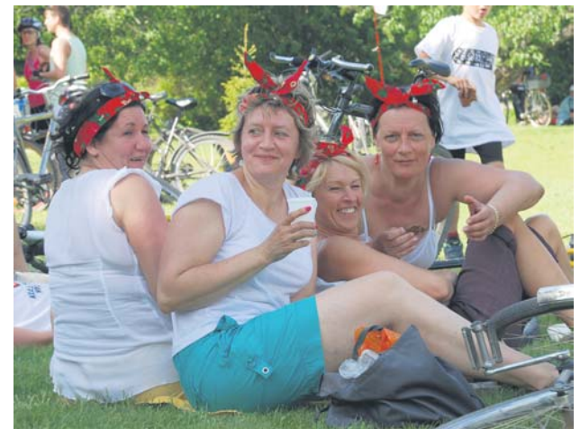
Arī šogad velofestivāla dalībnieki tika aicināti padomāt par interesantu noformējumu un netradicionālu komandas nosaukumu.