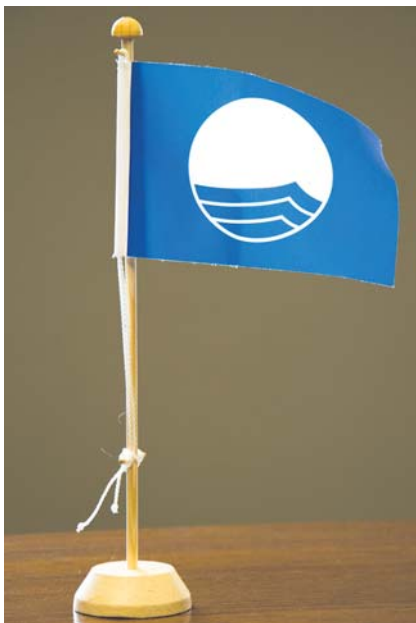
Zilais karogs ir viena no populārākajām vides kvalitātes zīmēm pasaulē, un Mārtiņsalas peldvieta Kuldīgā to saņem jau piekto gadu pēc kārtas.

Gada balvas labāko darbu izstāde līdz pat 8. jūnijam apskatāma Rīgā, Torņa ielā, uz atjaunotā Rīgas aizsargmūra abpus Rāmera tornim. SIGNETA REIMANE, sabiedrisko attiecību speciāliste