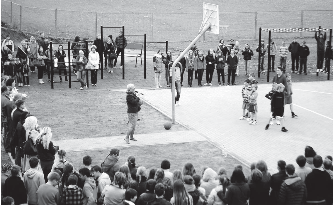
Kuldīgas Centra vidusskola, īstenojot projektu, izveidojusi strītbola laukumu.

Kuldīgas Centra vidusskola sadarbībā ar biedrību „Mēs savai skolai un pilsētai” īstenojusi ELFLA projektu „Strītbola laukuma izveide pie Kuldīgas Centra vidusskolas”.