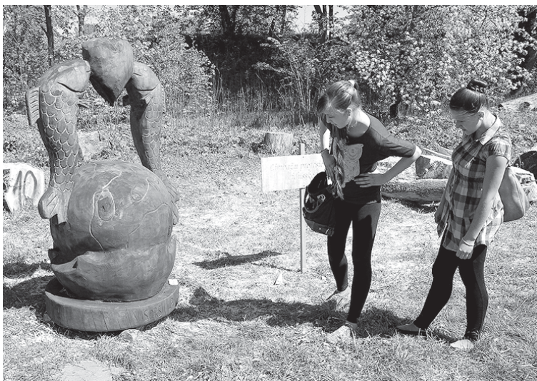
Koktēlniecības plenērā tapa dažādu skolu pārstāvju veidotas skulptūras par mīlestības tēmu.

16. maijā Mārtiņsalā, Kuldīgā, noslēdzās jau piektais koka skulptūru plenērs.