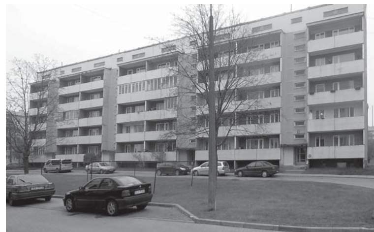
Plānots, ka siltumenerģijas ietaupījums pēc renovācijas SIA „Kuldīgas komunālie pakalpojumi” apsaimniekojamajā 56 dzīvokļu mājā būs 37%.