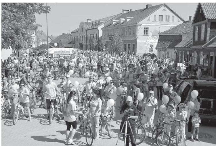
Velodiena tiek rīkota, lai veicinātu veselīgu dzīvesveidu un popularizētu riteņbraukšanu Kuldīgas novadā.

500 dalībnieki pasākuma dienā no organizatoriem saņem T-krekus ar pasākuma simboliku.