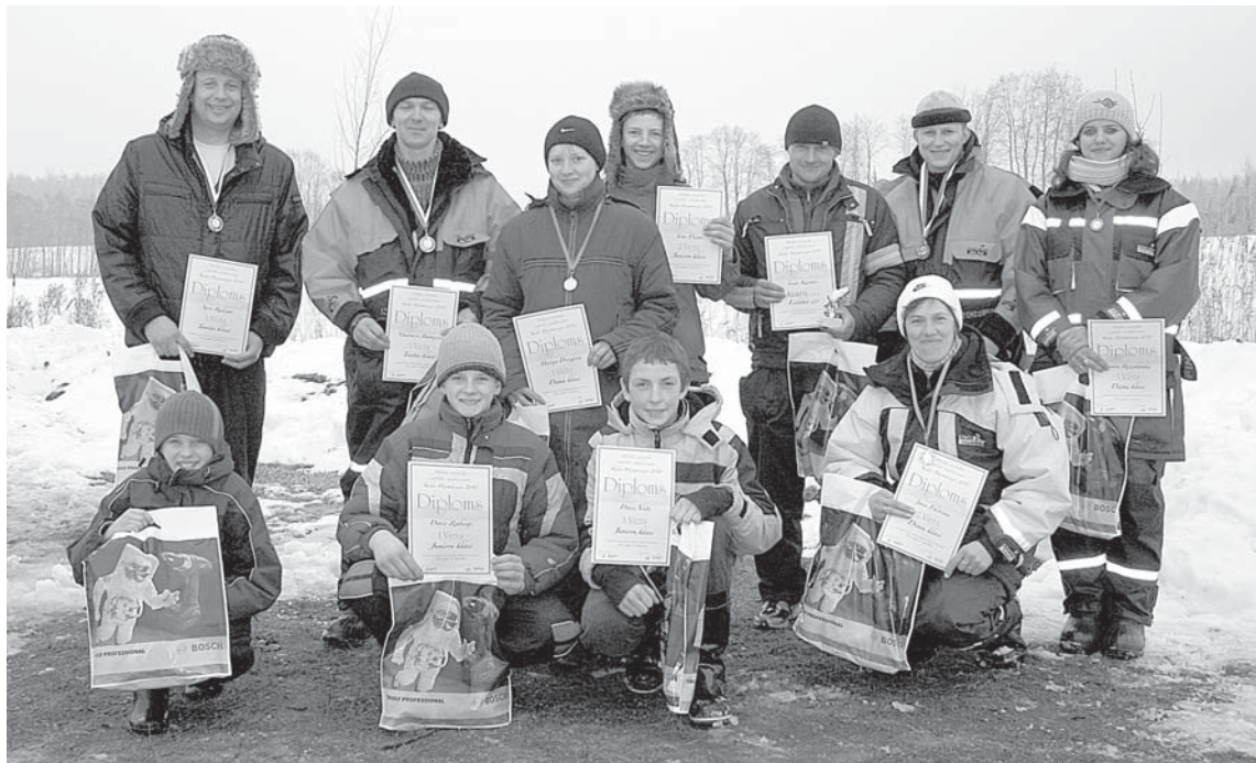
Pagājušā gada sacensību uzvarētāji priecīgi par jauki pavadīto dienu un gūtajiem panākumiem.

12. februārī jau piekto gadu Vārmes pagasta Šķēdes Dzirnavezerā notiks sacensības zemledus makšķerēšanā.