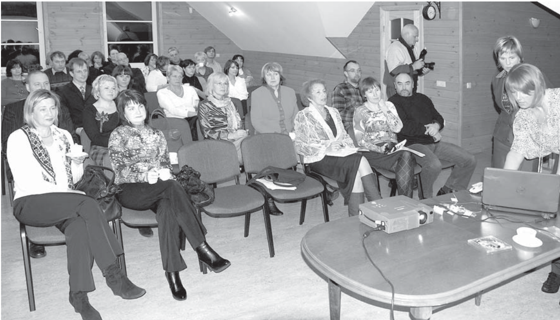
Lai atskatītos uz paveikto pērn un iezīmētu šī gada aktuālākās tendences, „Tūrisma gada saietā” šogad piedalījās gandrīz 40 tūrisma uzņēmēji.

Kuldīgas tūrisma attīstības centra rīkotais „Tūrisma gada saiets” šogad notika 28. janvārī Rumbas pagasta „Bukaišos”.