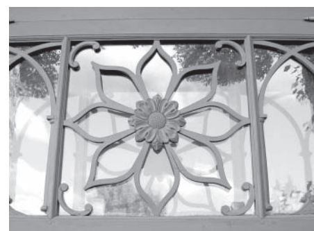
VAI PAZĪSTI KULDĪGU 4. LPP.