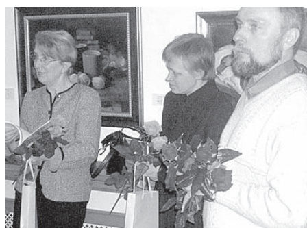
PIEMIRSTĀ KOLEKCIJA RĪGĀ 2. LPP.