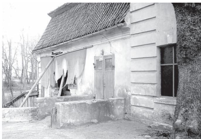
Tāda postaža paveras uz vienu no Kuldīgas vecpilsētas vizītkartēm – pils dzirnavām. Īpašnieces nolaidīgā attieksme rosinājusi amatpersonas izšķirties par arhitektūras pieminekļa atsavināšanu.