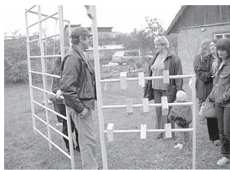
DARĪSIM PAŠI ARĪ ŠOGAD 4. LPP.